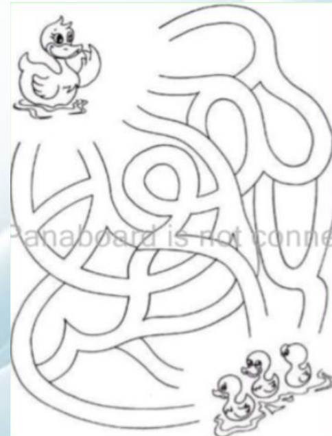
Игра «Помоги уточке пройти к утятам»