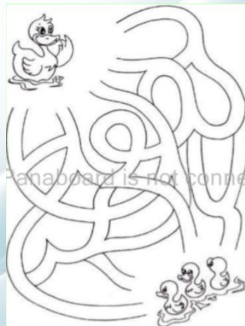
Игра «Помоги уточке пройти к утятам»