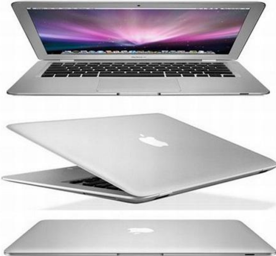
А здесь его современник. 010110101010 101011010111010 0110101011010101 10101010110101010101010101 1010101010101010101010101010 10101010111010101011 10101101011010101010101010101010