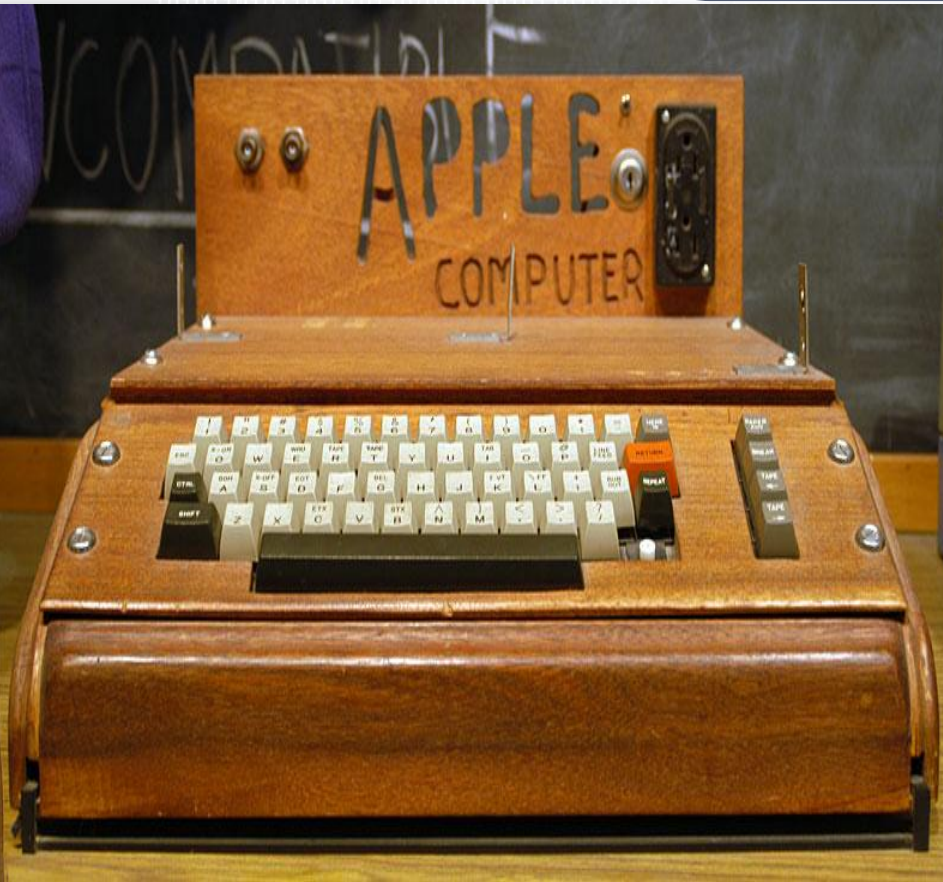
Вот первый компьютер Apple от Стива Джобса.