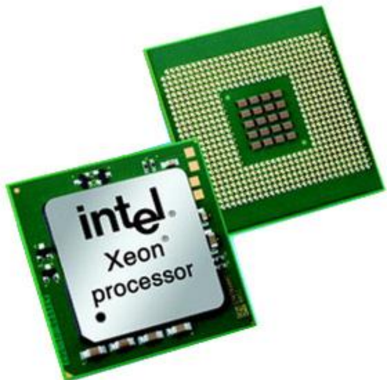
Рис.3 Intel Original LGA1366 Xeon E5502 (1.86 / 4.8GT / sec / 4M)