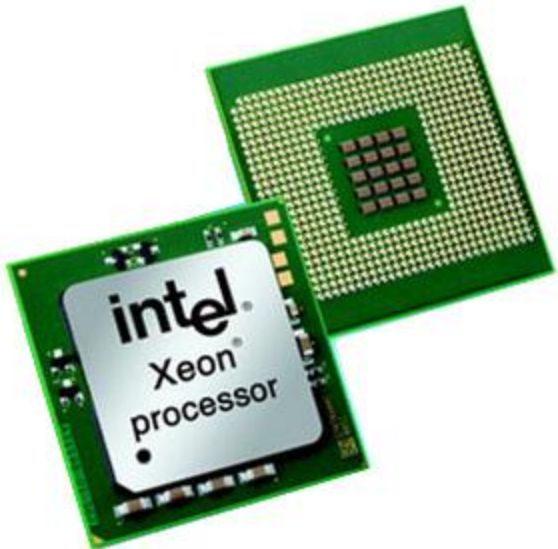
Рис.3 Intel Original LGA1366 Xeon E5502 (1.86 / 4.8GT / sec / 4M)