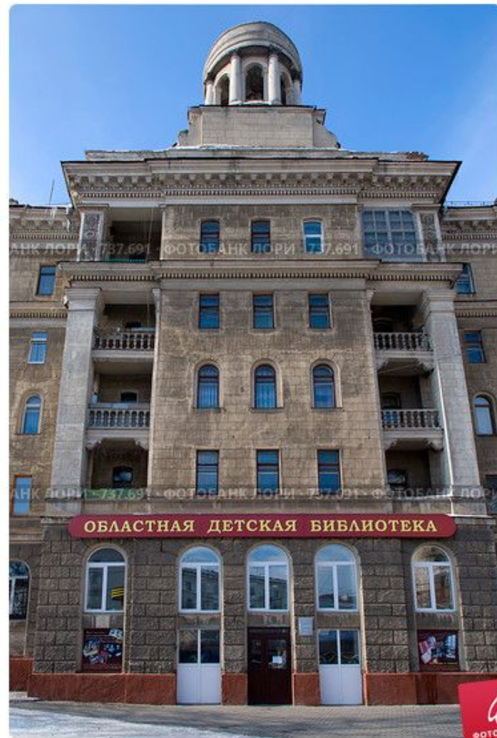
Тула. Областная детская библиотека.