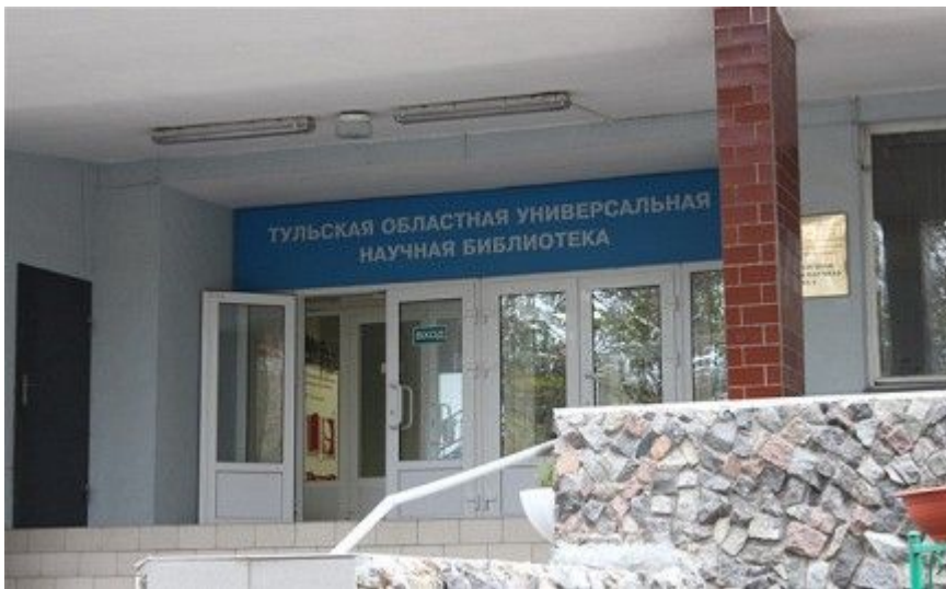
Тульская областная универсальная научная библиотека