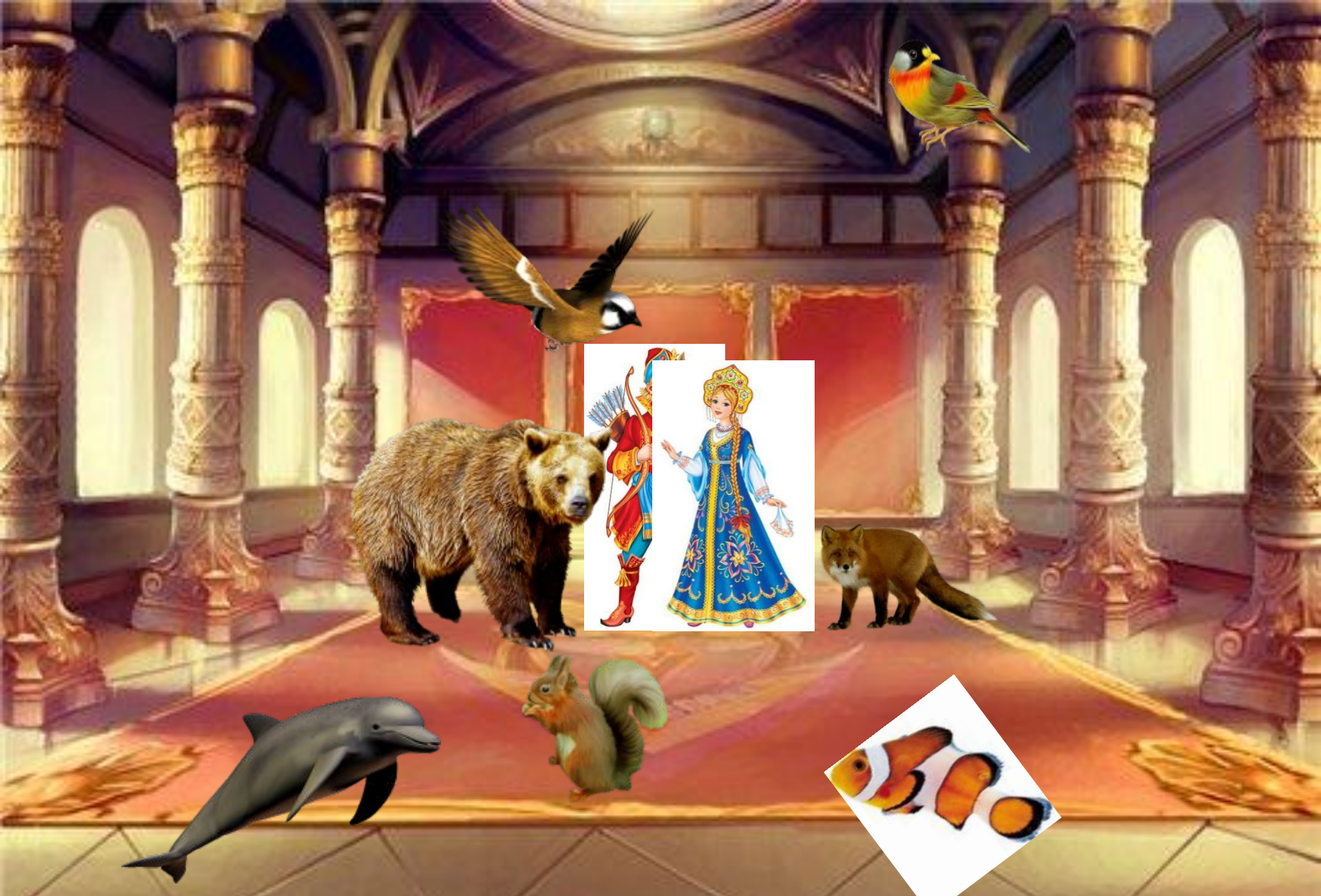
Накормил Иван Царевич Змея Горыныча, расколдовал Василису Прекрасную и устроил пир на весь мир. И пришли к ним в гости звери, птицы и рыбы. Тут и сказке