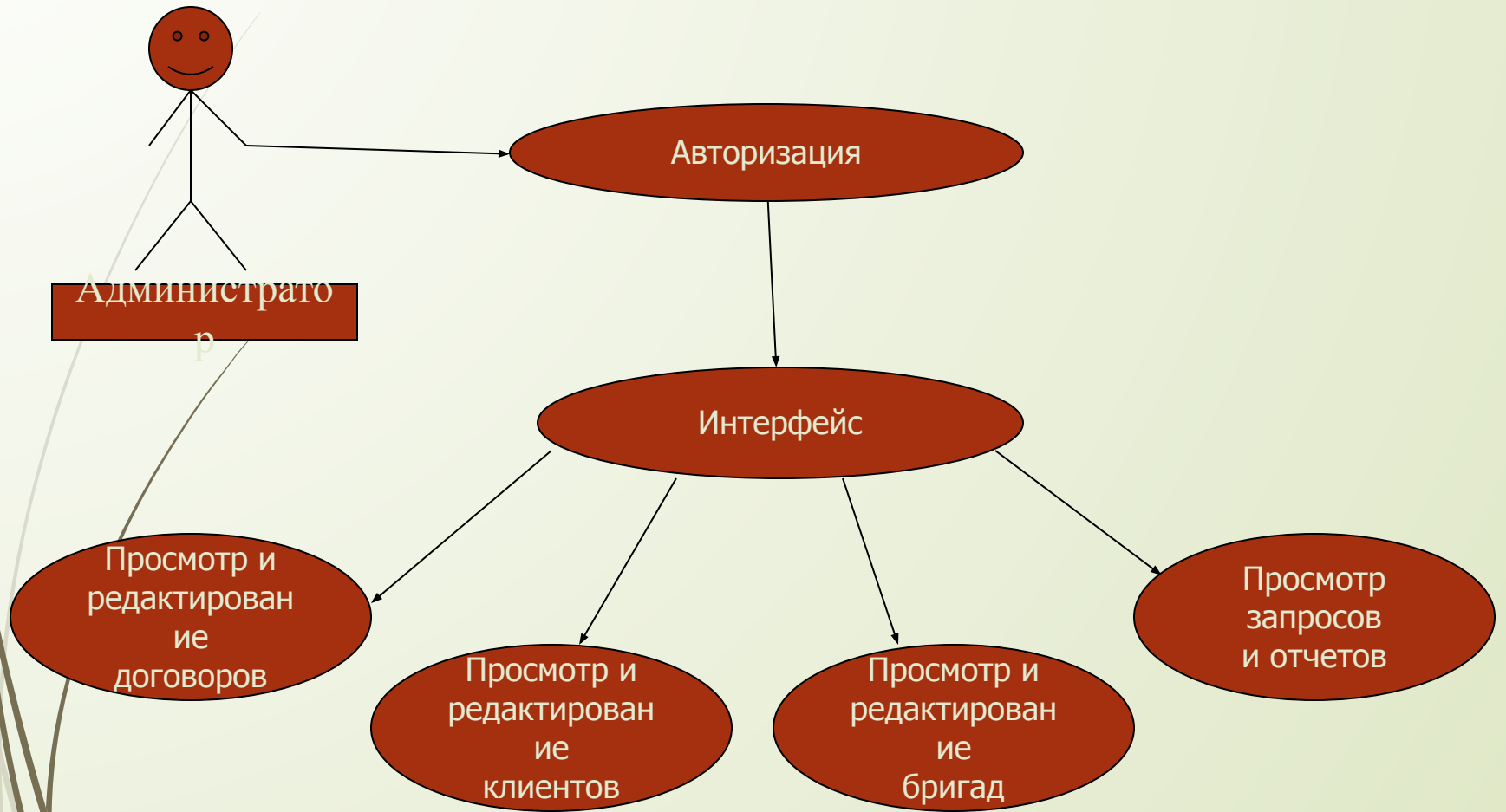
Диаграмма Use Case