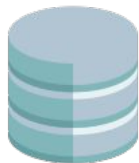
База данных соискателей