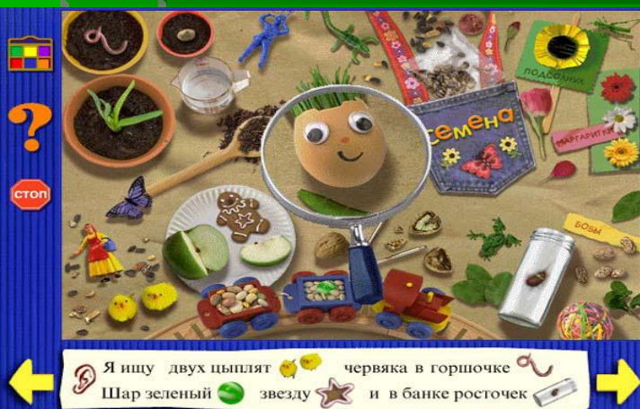
Рис.4 «Маленький искатель»

Для самых маленьких создана серия CD-дисков "Маленький искатель" (Scholastic Inc.) (рис.4) - игры для детей от 3 до 5 лет. Игра представляет собой рифмованные картинки-загадки и мастерски сложенные головоломки, обучающие чтению, стихосложению, азам математики и многому другому