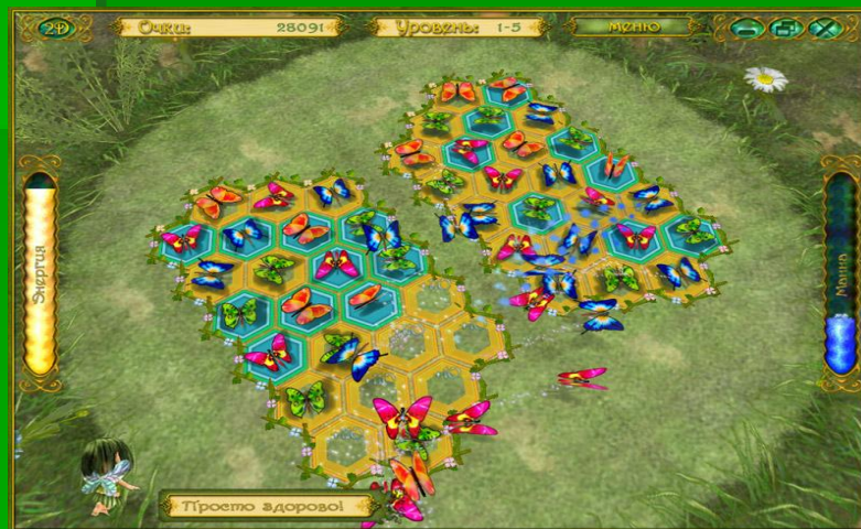
Рис.2 Пример логической игры «Сказочная история»