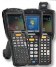
MC3200 Brick, Gun, Rotate, CE, Android