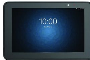
ET50/55 Android/Windows 10