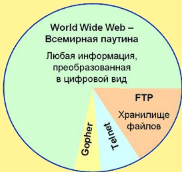
Структура информационного наполнения сети Internet