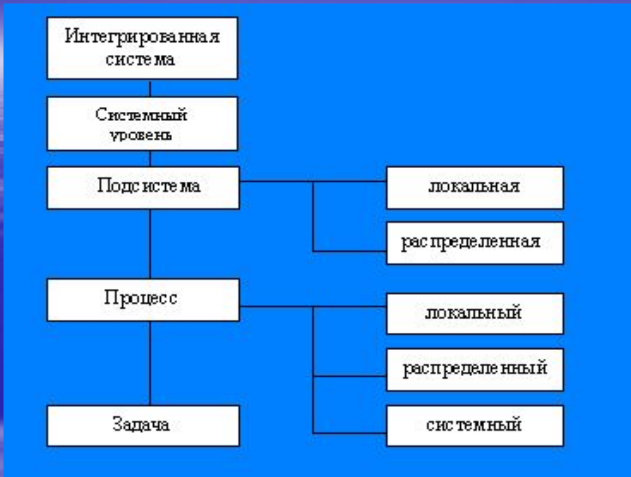
Рис. 2.1. Структура интегрированной системы