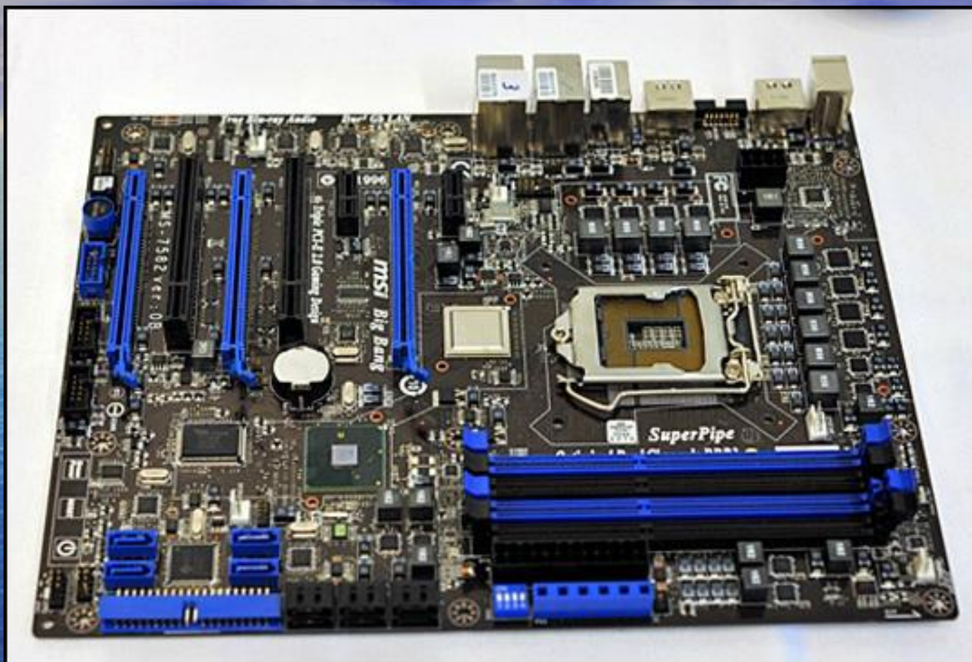
MSI Big Bang - системная плата