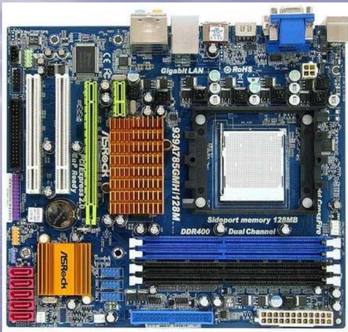
ASRock 939A785GMH128M - системная плата micro-ATX на чипсете AMD 785G