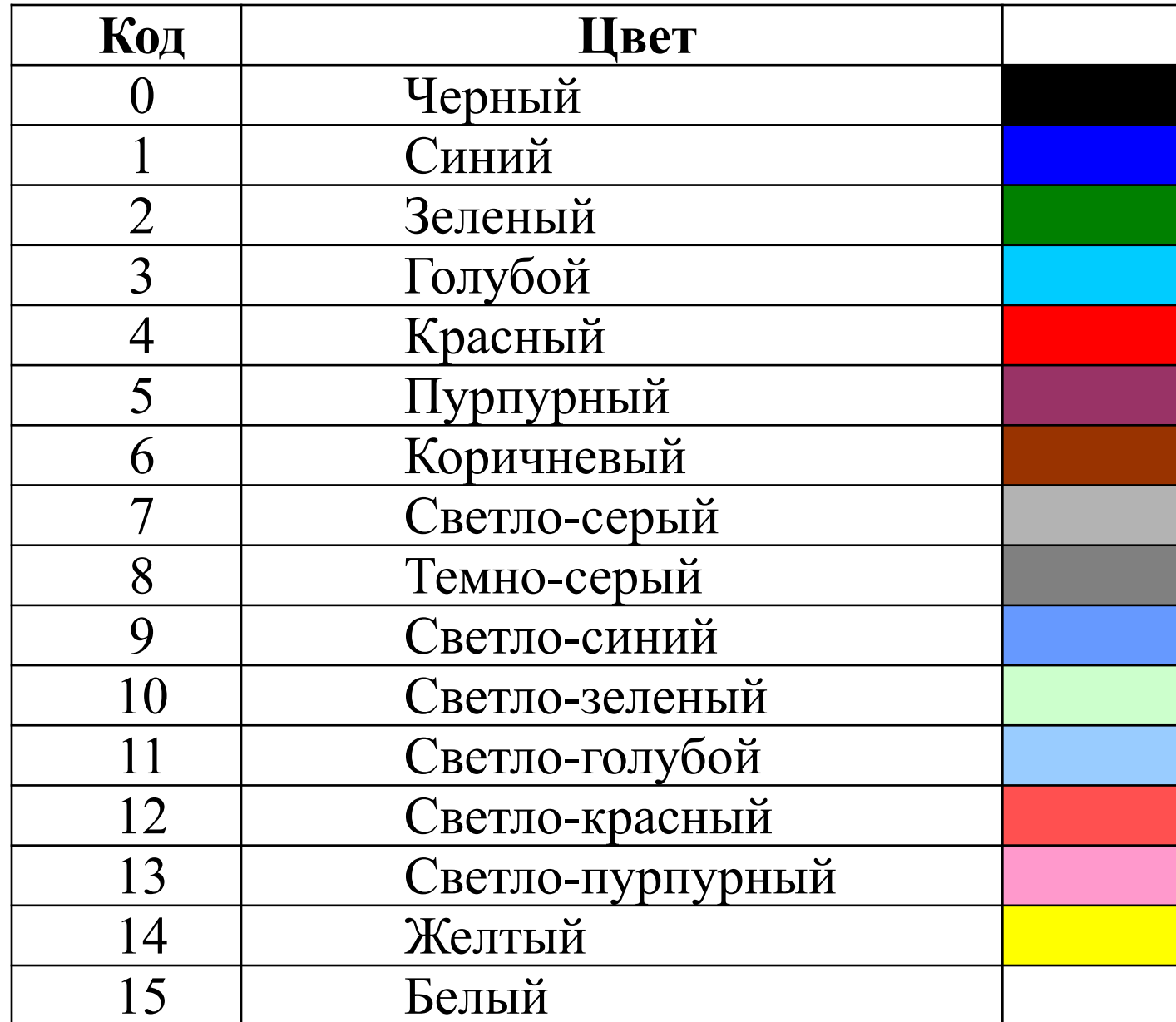
ТАБЛИЦА. КОДЫ И СООТВЕТСТВУЮЩИЕ ЦВЕТА.