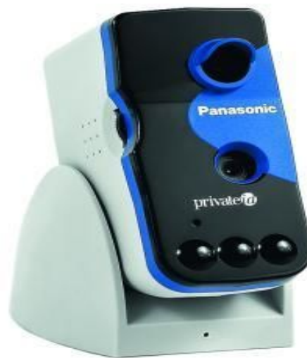
Web-камера и сканер сетчатки глаза