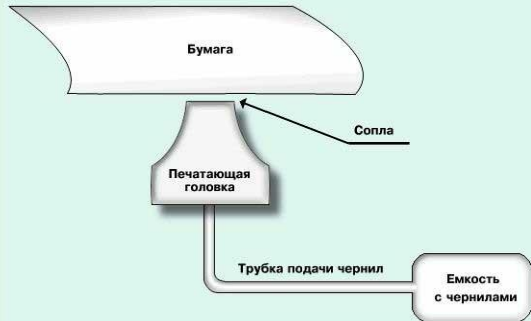
Принцип печати струйного принтера

Цветные струйные принтеры имеют более высокое качество печати по сравнению с игольчатыми цветными принтерами и невысокую стоимость по сравнению с лазерными. Цветное изображение получается за счет использования (наложения друг на друга) четырех основных цветов. Уровень шума струйных принтеров значительно ниже, чем у игольчатых, поскольку его источником является только двигатель, управляющий перемещением печатающей головки. При черновой печати скорость струйного принтера значительно выше, чем у игольчатого. При печати с качеством LQ скорость составляет 3-4 (до 10) страницы в минуту. Качество печати зависит от количества сопел в печатающей головке - чем их больше, тем выше качество. Большое значение имеет качество и толщина бумаги. Выпускается специальная бумага для струйных принтеров, но можно печатать на обычной бумаге плотностью от 60 до 135 г/кв.м. В некоторых моделях для быстрого высыхания чернил применяется подогрев бумаги. Разрешение струйных принтеров при печати графики составляет от 300*300 до 720*720 dpi.