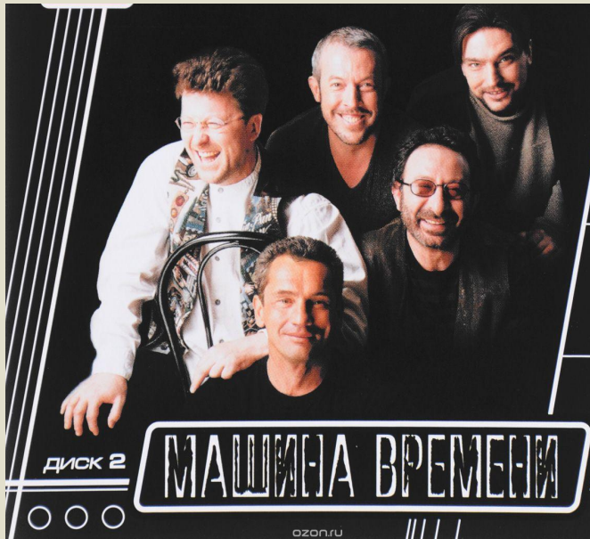
«Машина времени» (1969- наши дни)