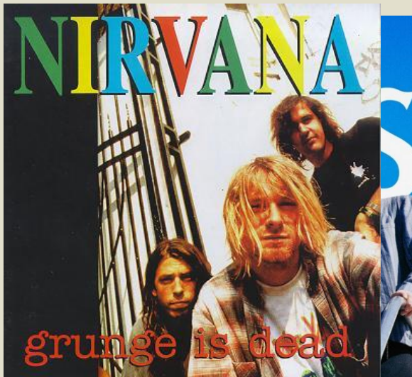
Рис. 4. "Nirvana" (1987-1994) (США) ведущий британский жанр гранж