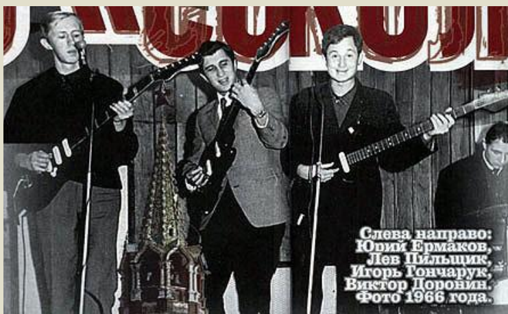
«Сокол» - первая советская рок-группа (тогда они назвались бит-группы), «легенда» русского рока. (1964-1969)