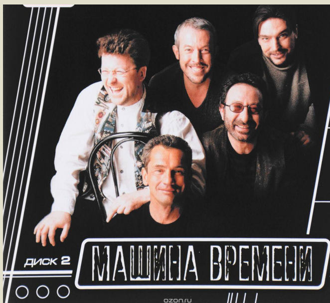
«Машина времени» (1969- наши дни)