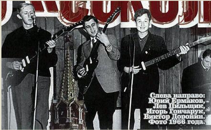
«Сокол» - первая советская рок-группа (тогда они назвались бит-группы), «легенда» русского рока. (1964-1969)