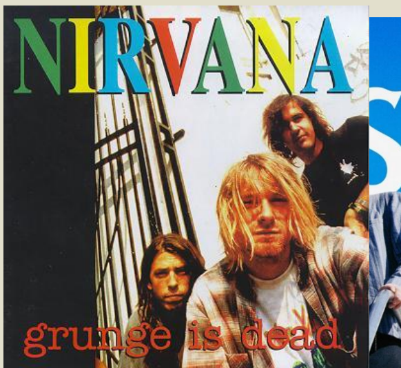
Рис. 4. "Nirvana" (1987-1994) (США) ведущий британский жанр гранж