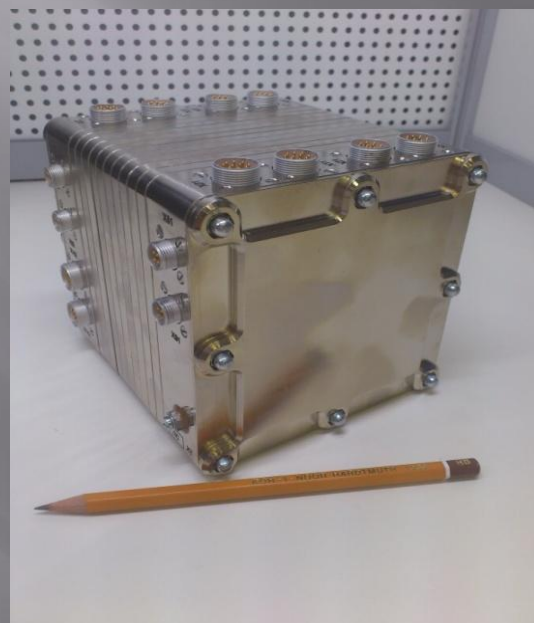
ЦВМ22- прототип (КА «Глонасс- К»)