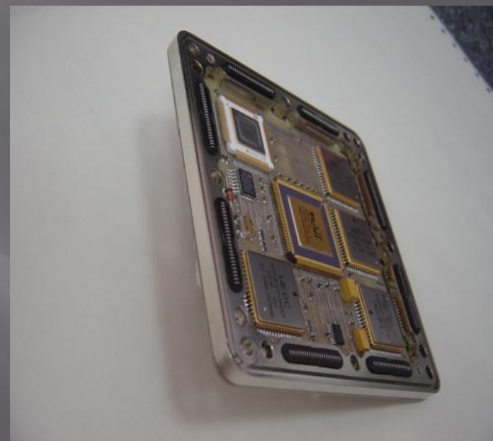
ЦВМ28-первый этап проекта