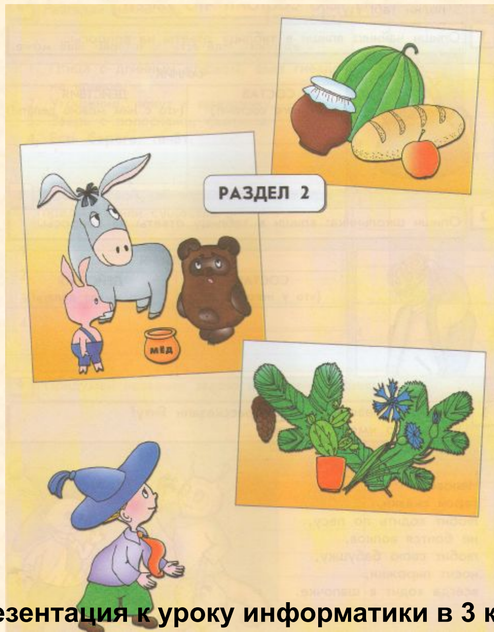
Презентация к уроку информатики в 3 классе по программе А.В.Горячева (II четверть)