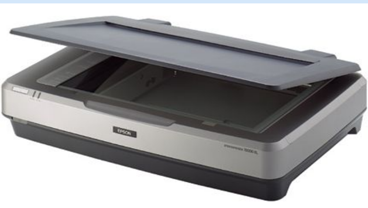
Настольный (планшетный) сканер

Сканер – устройство оптического ввода информации.