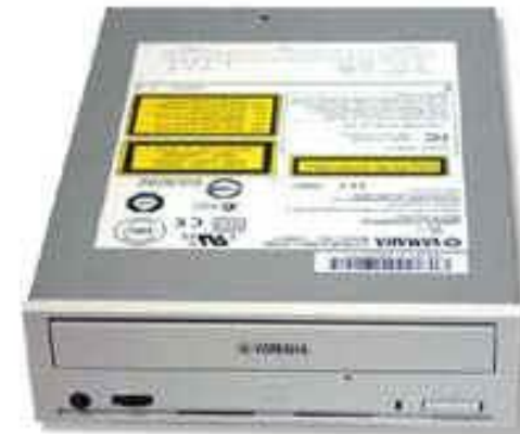
Устройство для чтения и записи оптических дисков