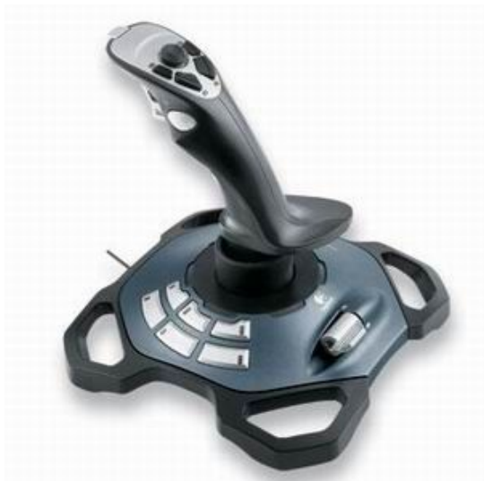
Игровой пульт (геймпад)