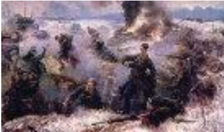
Защитники Брестской крепости