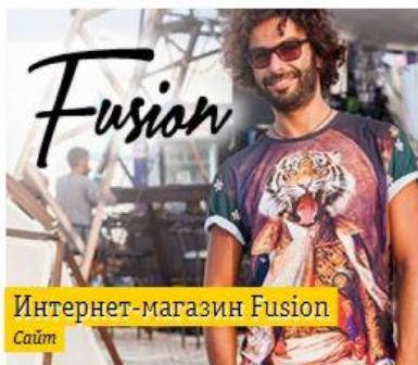
Интернет-магазин Fusion Сайт