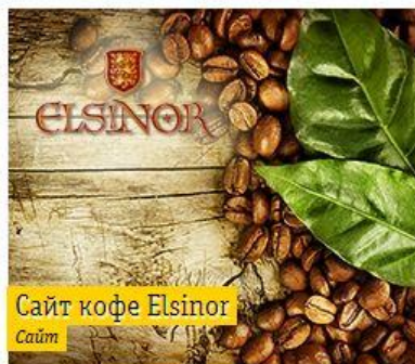
Сайт кофе Elsinor Сайт