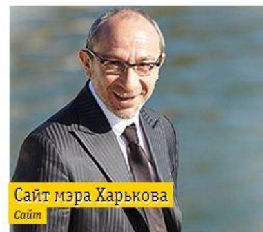
Сайт мэра Харькова Сайт