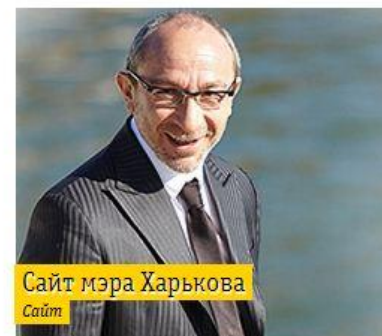
Сайт мэра Харькова Сайт