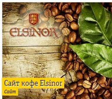
Сайт кофе Elsinor Сайт