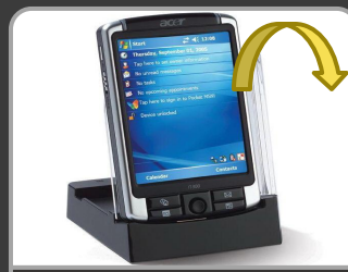
КПК Acer n300