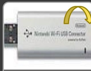
Nintendo Wi-Fi USB Connector