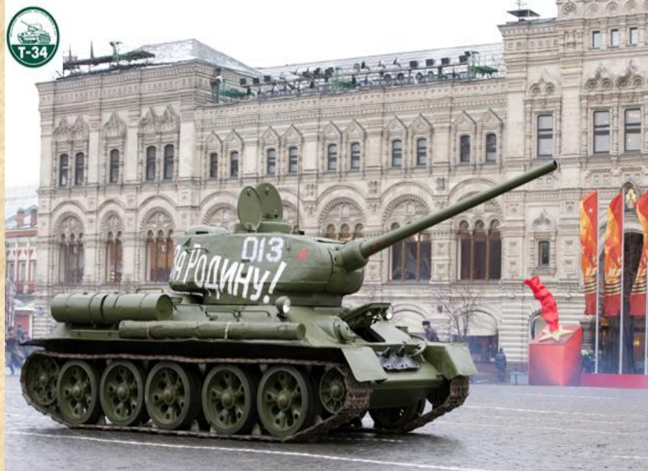
Москва, Красная площадь, 7 ноября 2009 года