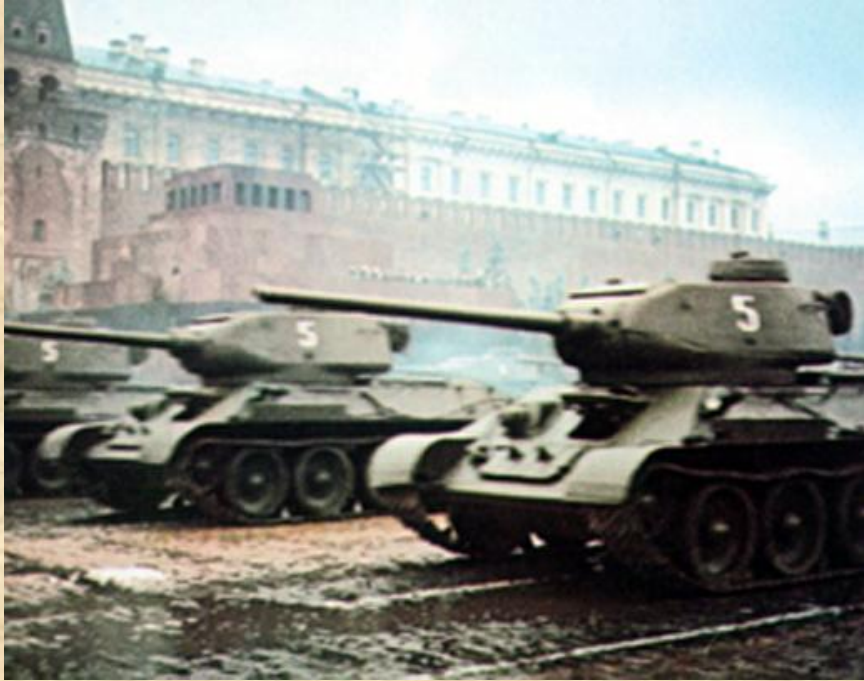
Танки Т-34 на Параде Победы. Москва, Красная площадь, 24 июня 1945