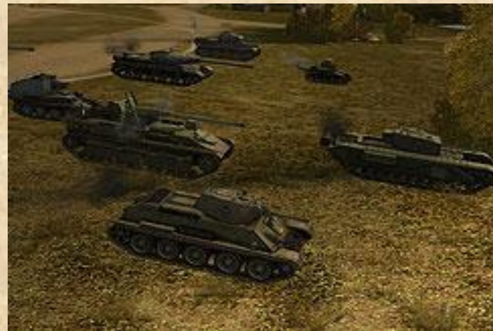
Огромный парк танков