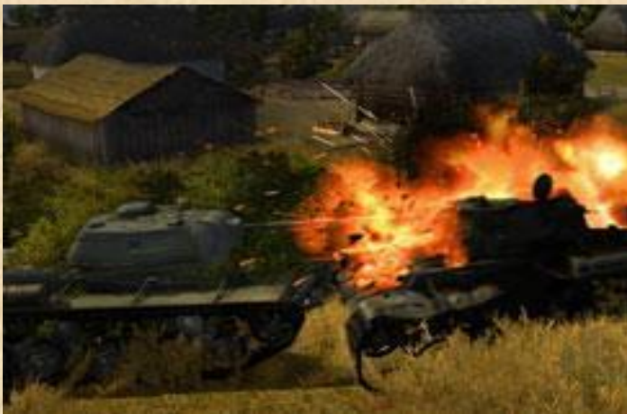
Убойная атмосфера танковых баталлий