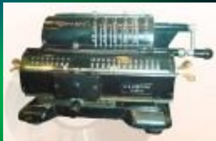
Арифметическая машина Лейбница