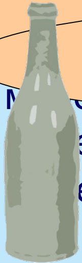
БУТЫЛКА МИНЕРАЛЬНАЯ ВОДА

СЮДА СТАКАН ПОСТАВИТЬ НЕЛЬЗЯ, ЗДЕСЬ ОН БУДЕТ СТОЯТЬ В СЕРЕДИНЕ СТОИТ СТАКАН. ЗНАЧИТ, В НЕМ – КОФЕ!