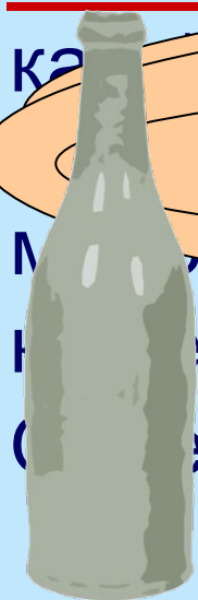
БУТЫЛКА МИНЕРАЛЬНАЯ ВОДА