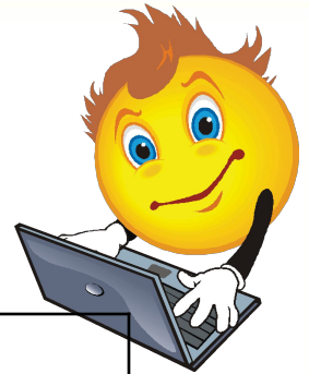
Расширенный код Листика