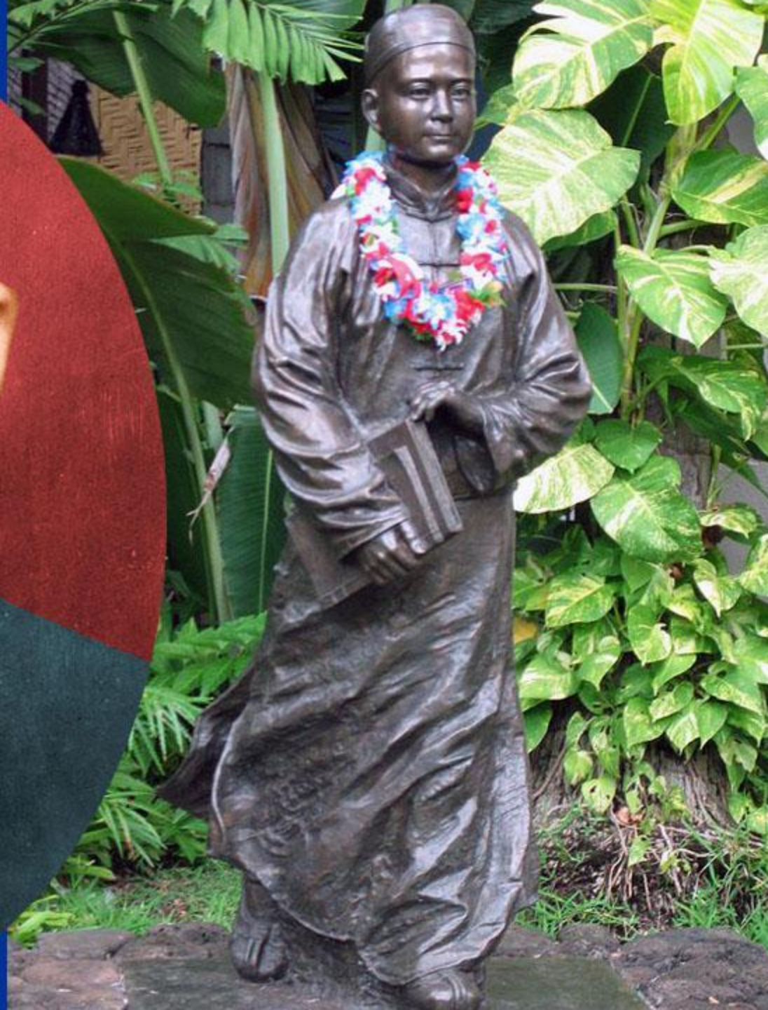
Сунь Ят- Сен