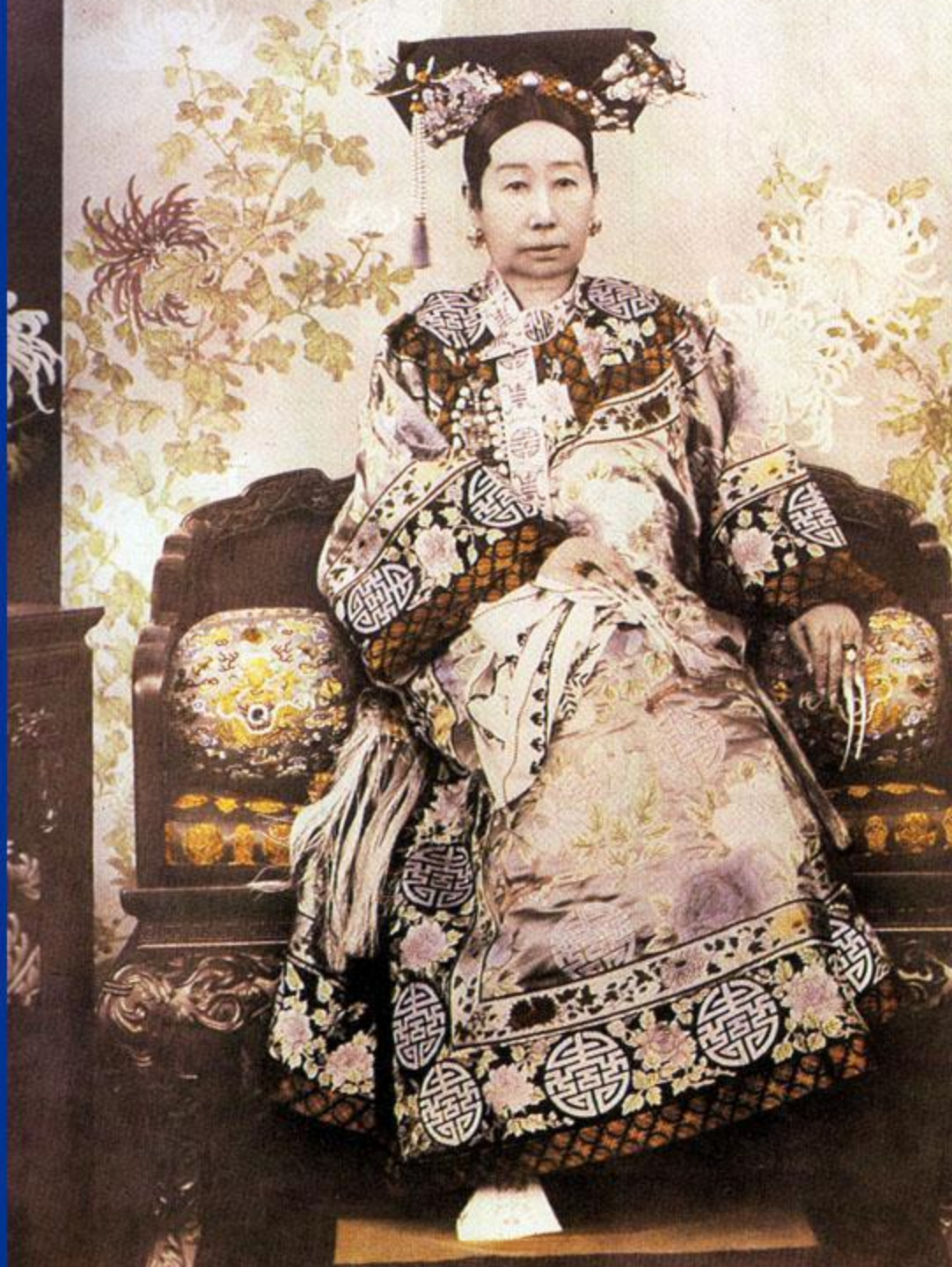
Цы Си (1835 — 1908)