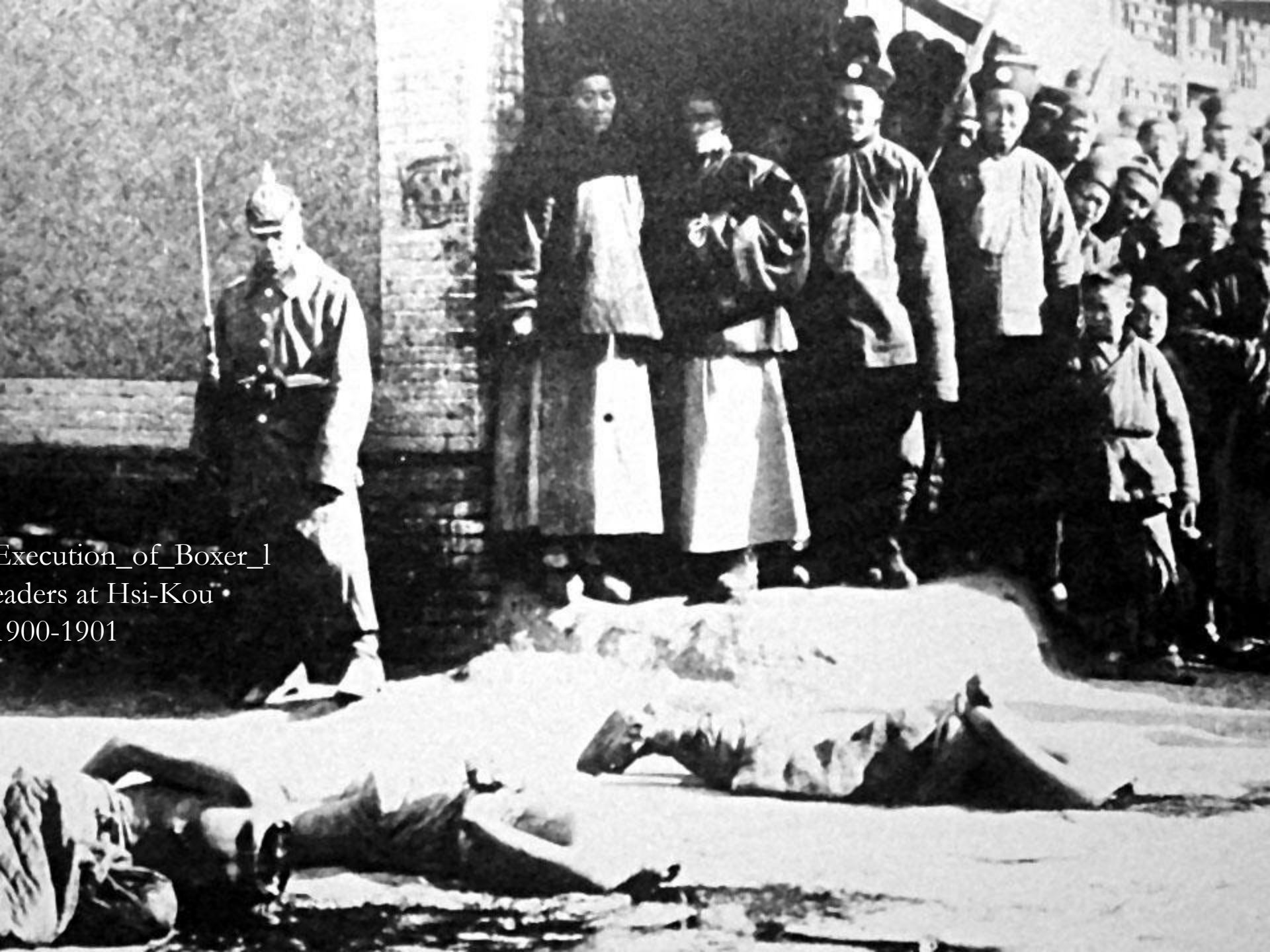
Execution_of_Boxer_1 Leaders at Hsi-Kou 1900-1901