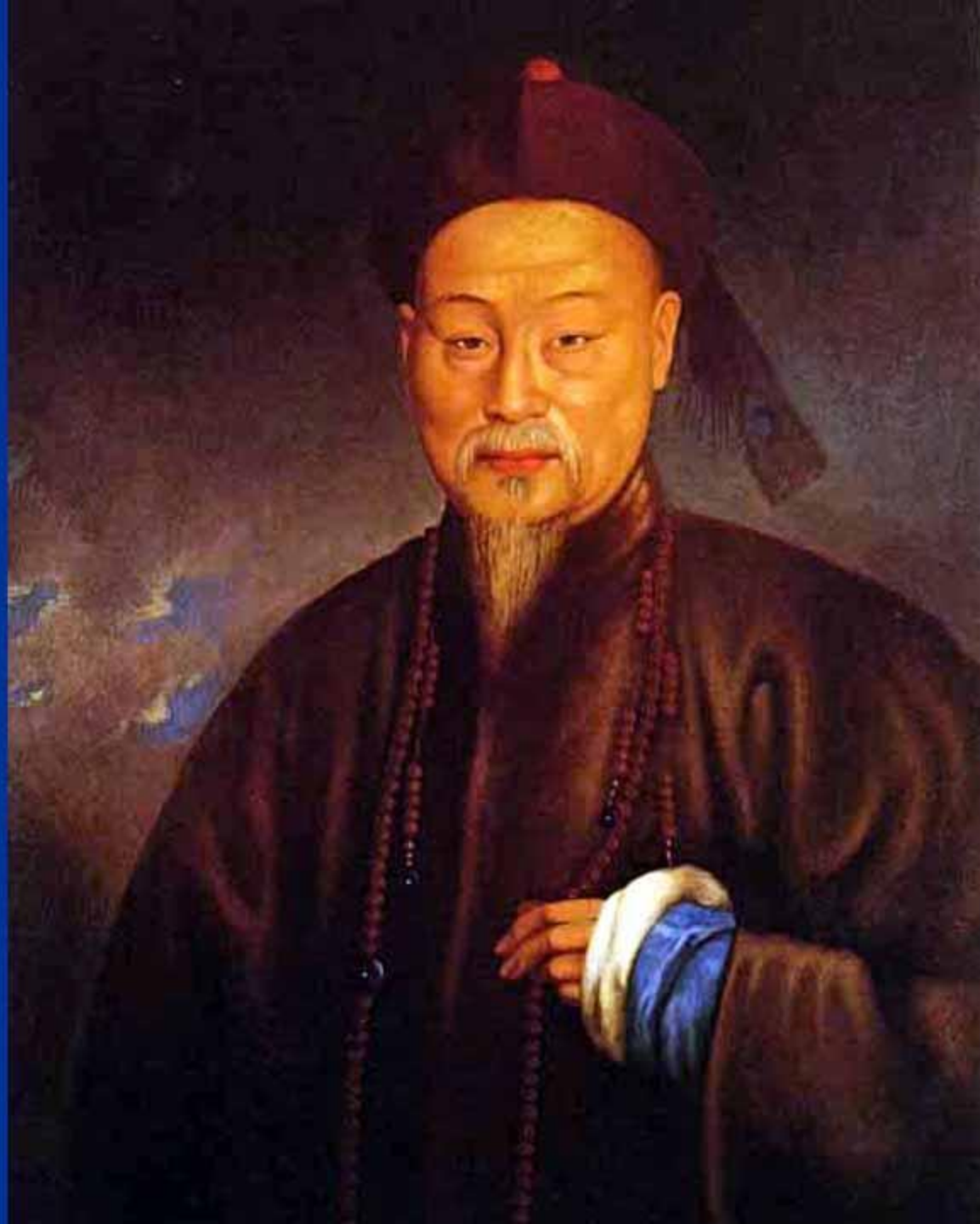
Линь Цзэсюй (1785—1850)