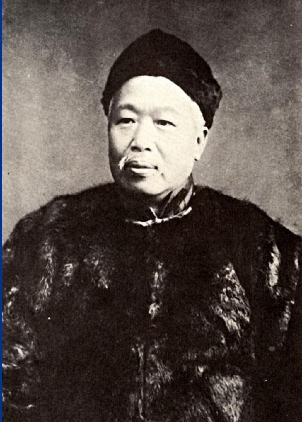
Кан Ювэй (1858 — 1927)