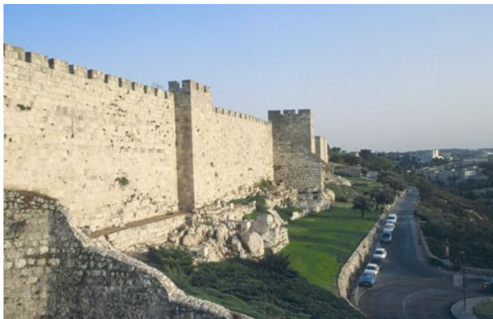
קטע מחומת ירושלים. החלק התחתון של החומה הוא מן התקופה החשמונאית