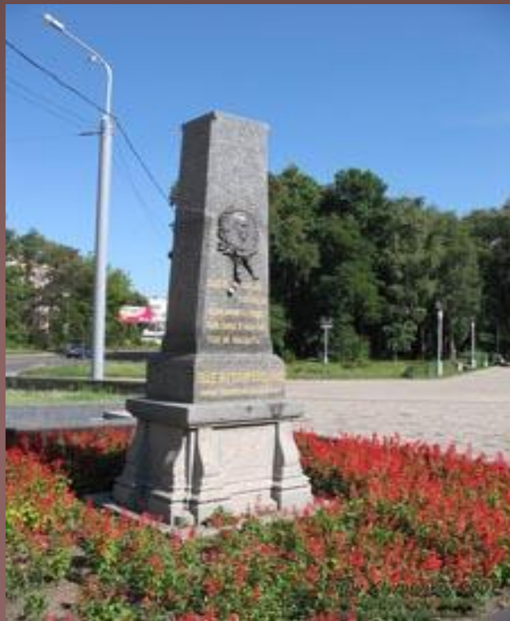
Могила І.П.Котляревському у Полтаві