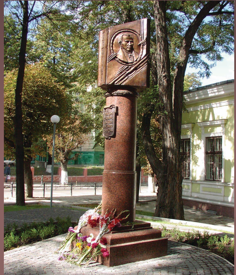
У 2004 році пам'ятник літописцям Русі-України, подвижникам українського письменства з барельєфом І. П. Котляревського і написом «Енеїда» відкрито у Чернівцях (скульптор В. Гамаль)