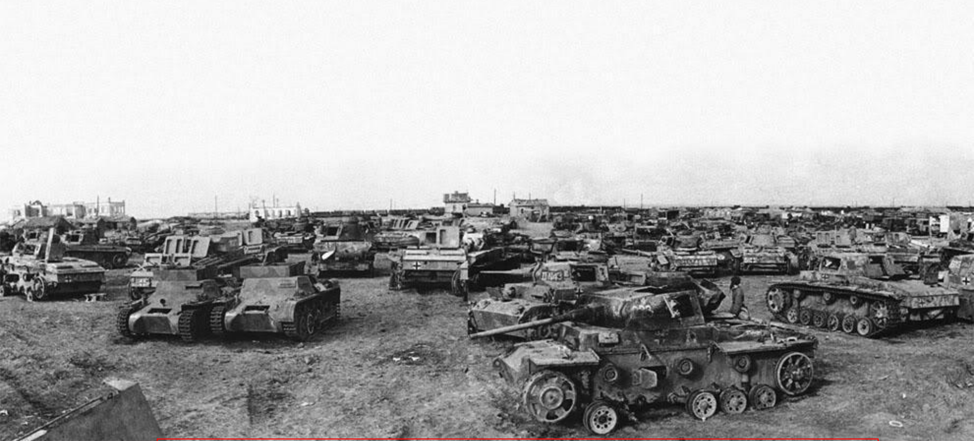
Немецкие танки подбитые в сражении на Курской дуге

1943 г., 3 июля – начало битвы на Курской дуге