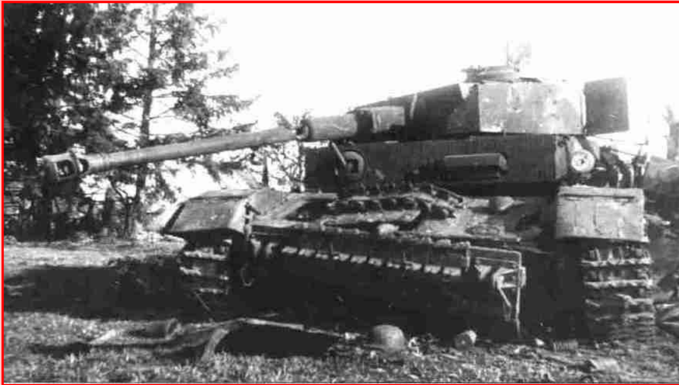
Подбитый немецкий танк

К осени 1942 г. расстановка сил на советско-германском стала меняться в пользу Красной Армии. Немецкие войска понесли тяжелые потери на Сталинградском и Северо-кавказском направлении и перешли к обороне.