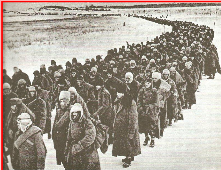
Пленные немецкие солдаты под Сталинградом

В окружение попали 330 тыс. человек во главе с фельдмаршалом Паулюсом. Попытки немецкого командования прорвать блокаду армии Паулюса не увенчались успехом. 2 февраля 1943 г. остатки армии Паулюса капитулировали. Общие потери немецко-фашистских войск под Сталинградом составили 800 тыс. человек, 2 тыс. танков, 3 тыс. самолетов. Эта победа положила начало коренному перелому в ходе Великой Отечественной войны.