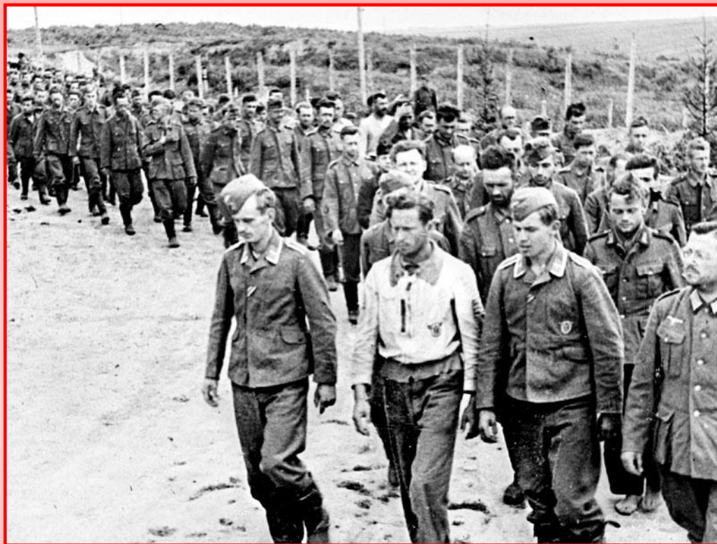
Пленные немцы под Курском

С начала контрнаступления Красной Армии под Сталинградом до конца 1943 г. Германия потеряла 2,2 млн. человек, 3,5 тыс. танков, 7 тыс. самолетов. Летом-осенью Германия потеряла на Восточном фронте половину своих войск. Свержение Муссолини в Италии лишило Германию одного из важнейших ее союзников.