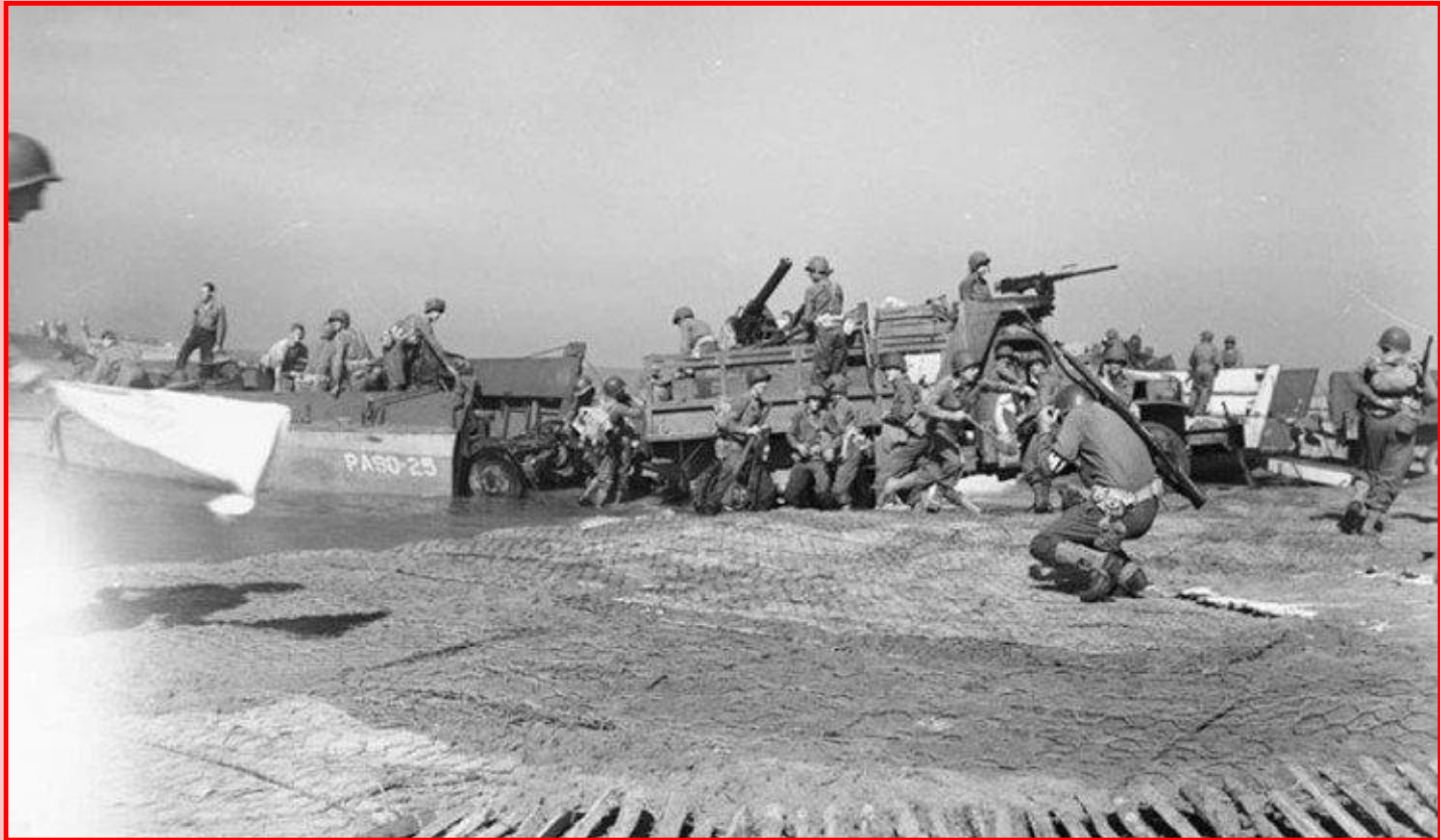
Англо-Американские войска в Италии

В июле 1943 г. союзные англо-американские войска высадились в Италии. Советское руководство ждало от союзников обещанной высадки во Франции, что значительно ускорило бы разгром фашистской Германии.