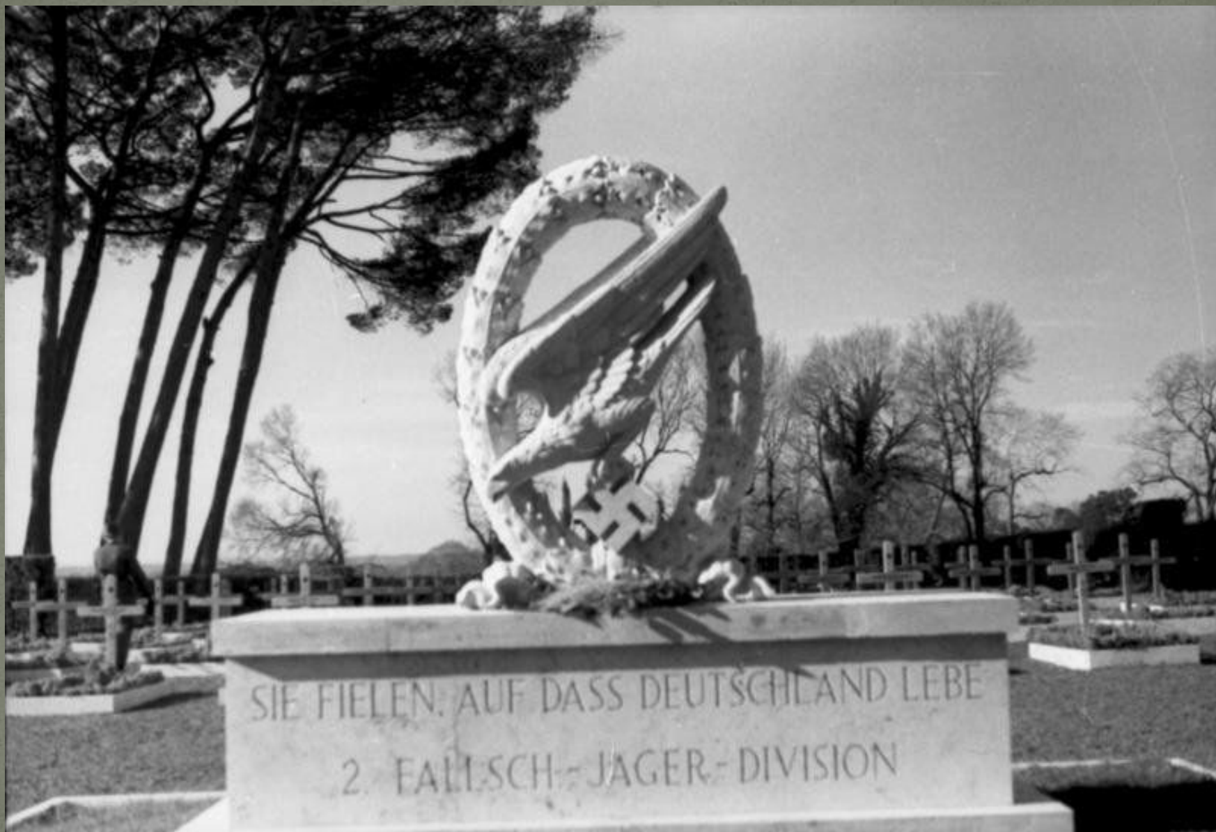
Internet Archive 197-18 Foto: Schneiders, Röhl | 1943