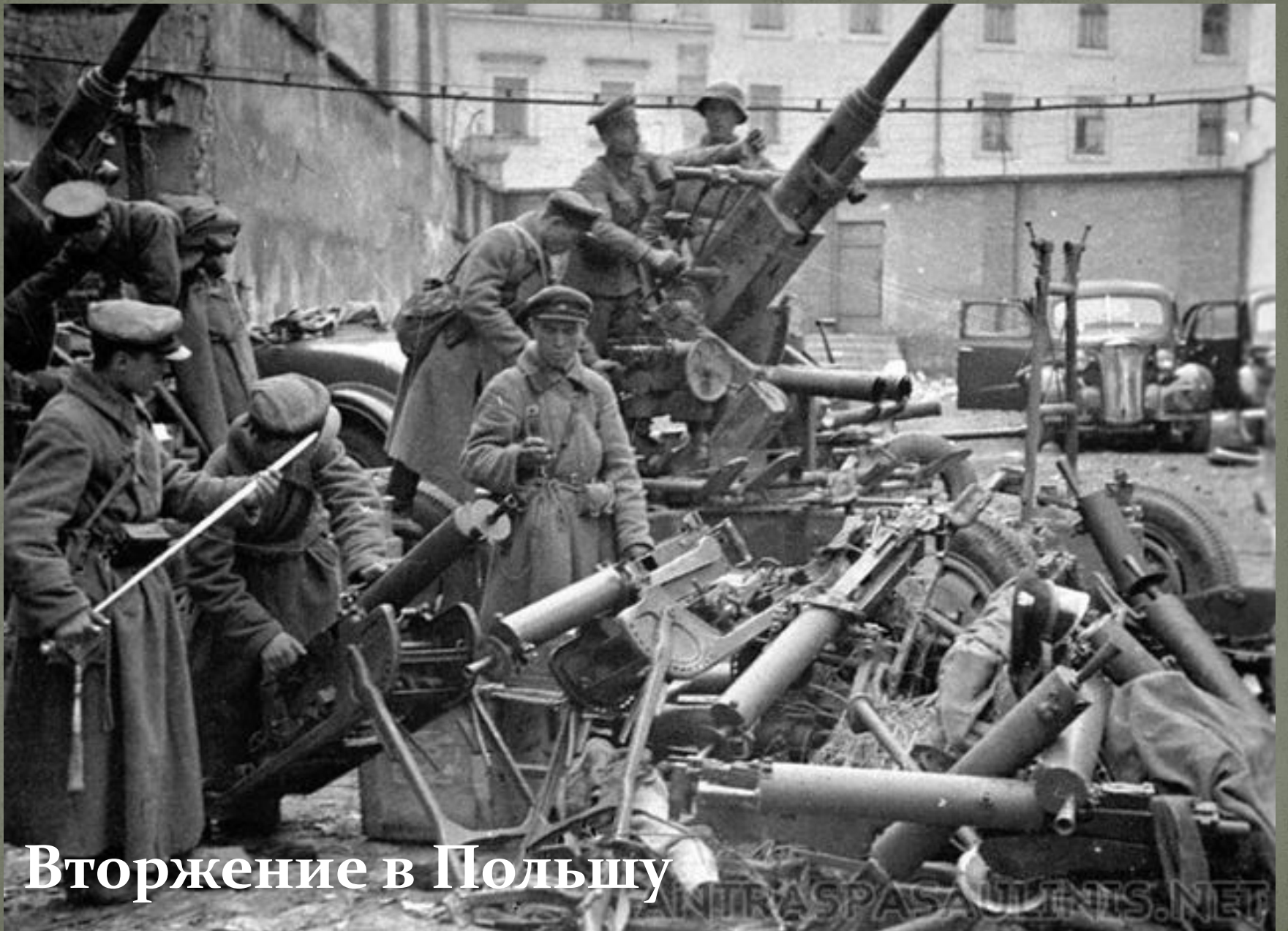
Вторжение в Польшу