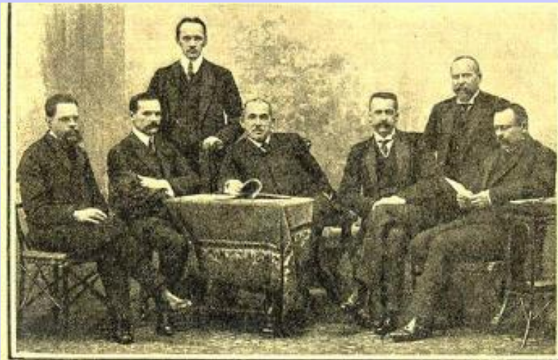
Президиумъ Гос. Думы 3-го созыва. Сидящіе: Г. Г. Замысловскій (ст. тов. secr.), бар. А. Ф. Мейендорфъ (тов. прес.), Н. А. Кошкинъ (предсѣдатель), кн. В. Н. Волковскій (тов. прес.), Е. П. Соломоновъ (секретарь). Стоящіе: М. А. Искровскій (тов. секретарь) и Н. Е. Антоновъ (тов. секретарь).

3 июня одновременно с роспуском Думы был обнародован новый избирательный Закон. В нем сохранялось деление на 4 курии, но ставка теперь делалась на дворян и буржуазию. 1 голос дворянина равнялся 260 голосам крестьян и 563 рабочим. Представительство иностранцев сокращалось, многие народы были лишены избирательных прав, как не достигшие гражданской зрелости.