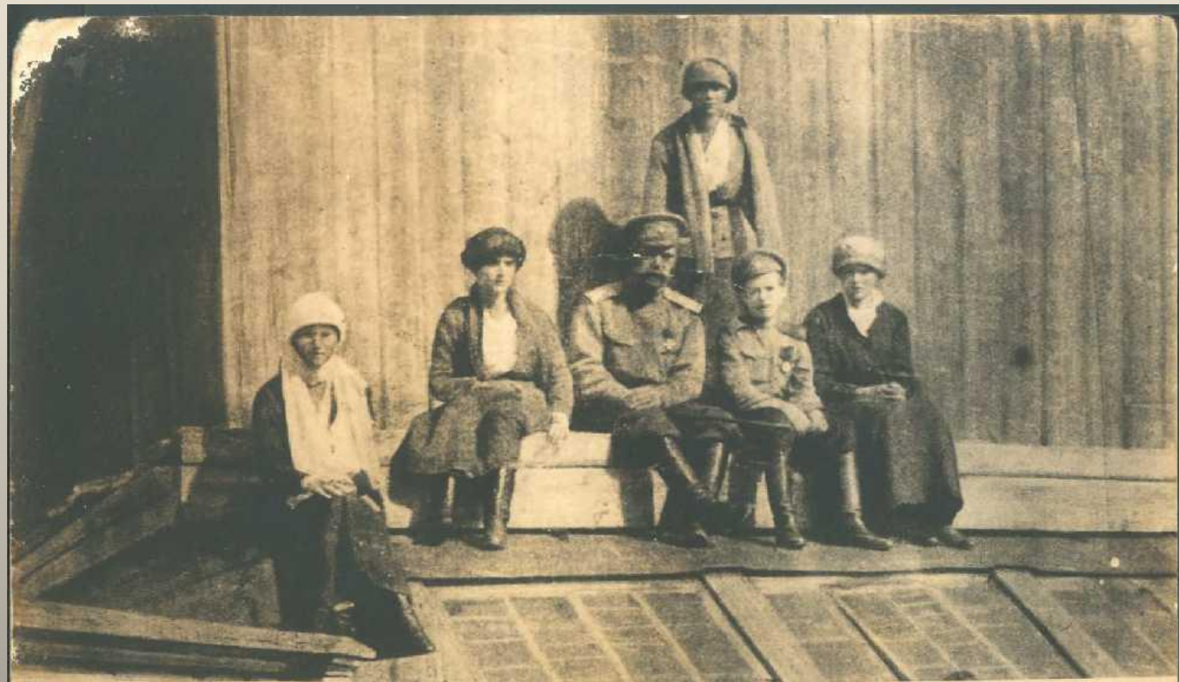
Августейшая Семья Романовых в Шолоховской Семьдере 1917г - Аирты 1918г.