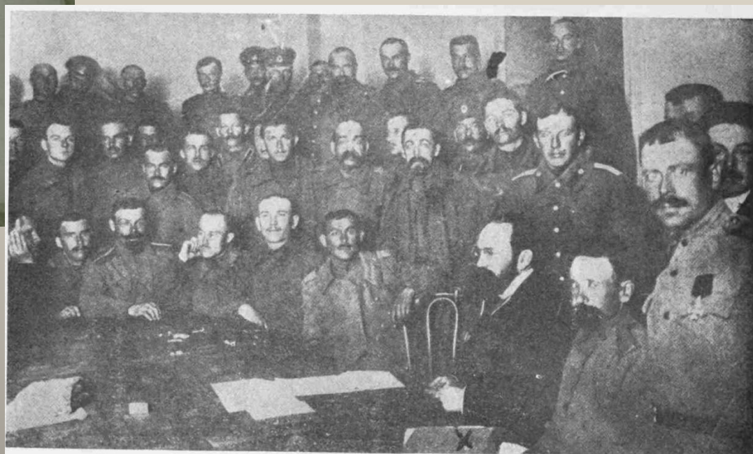
27 февраля образовался Совет Солдатских и Рабочих депутатов. Составление приказа № 1. Означенный х прис. повер. Н. Д. Соколов, составитель приказа