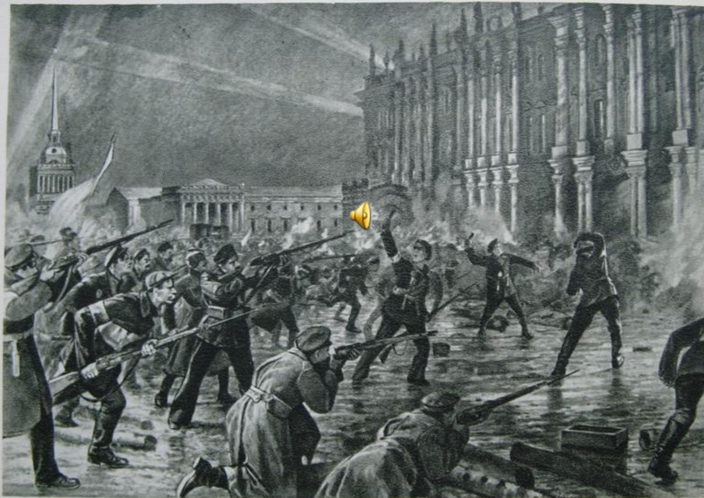
ШТУРМ ЗИМНЕГО ДВОРЦА 25 ОКТЯБРЯ 1917 г.