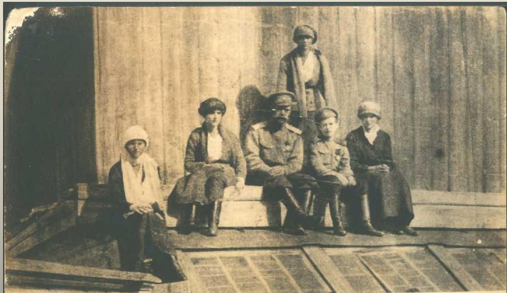
Августейшая Семья Романовых в Шолоховской ссылке 1917г - Актюбск 1918г.