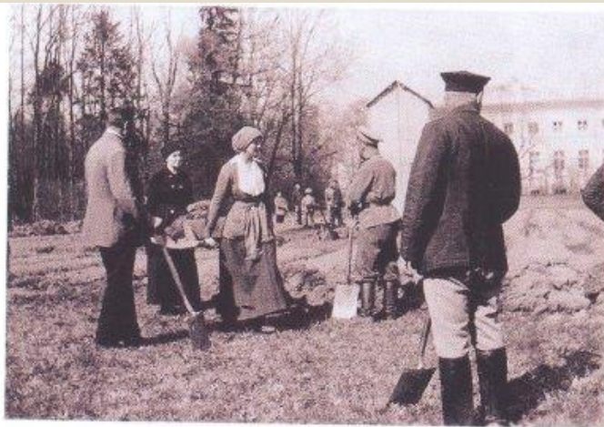
Николай II с Семей в Царском Селе после ареста. Работы в парке