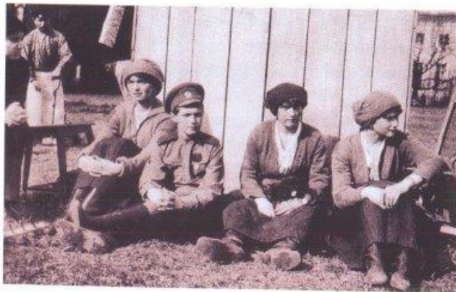
Цесаревич Алексей и Великие княжны Ольга, Анастасия и Татьяна. Отдых после работы на огороде парка Александровского дворца. Апрель 1917