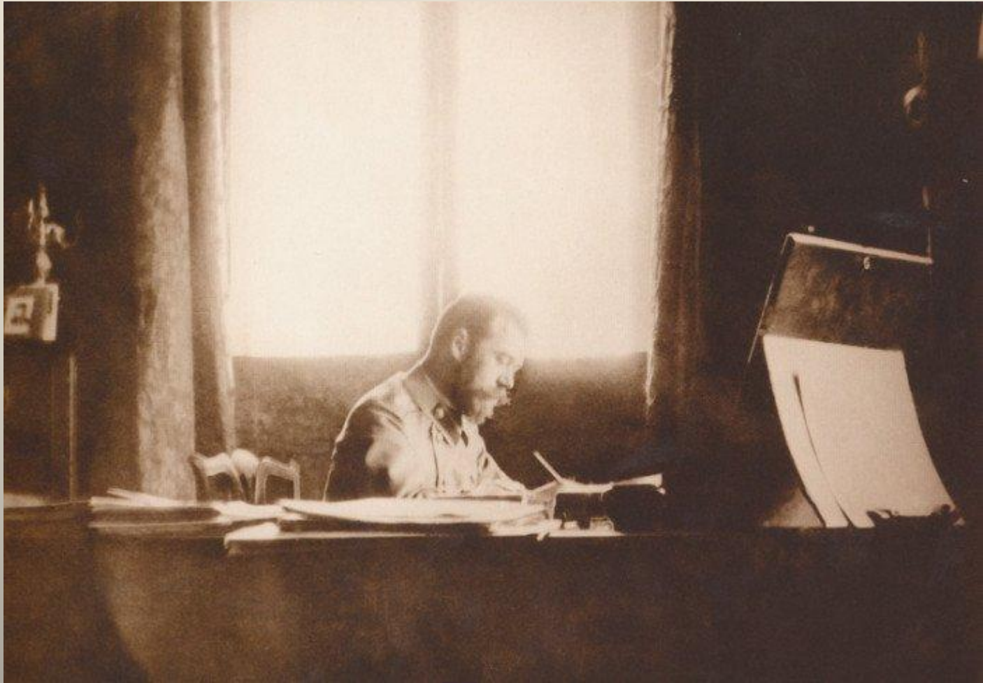
Подписание Николаем II акта об отречении от престола