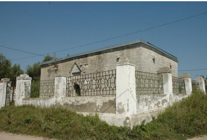
...мавзолей правителя Касимовского и Казанского ханств