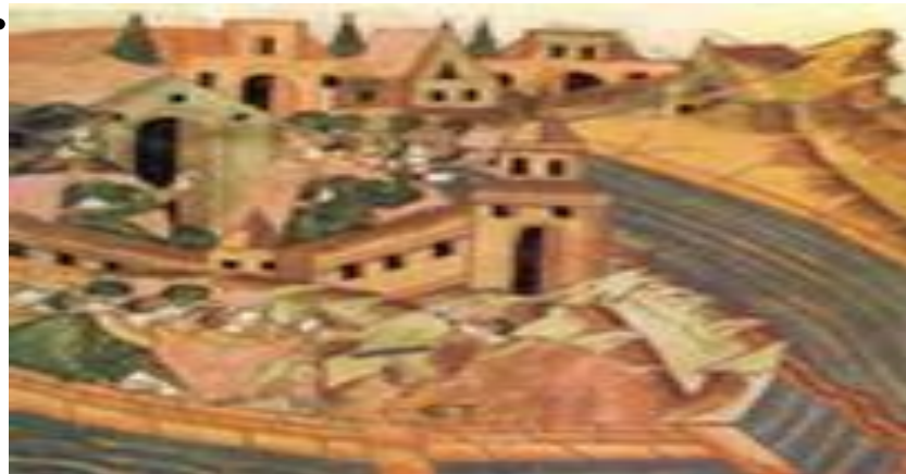
Строительство русской крепости на границе. Миниатюра Лицевого свода.

○ В 20-е-40-е годы на территории расселения мордвы русскими гарнизонами с помощью местного населения возводятся города-крепости: Васильсурск, Мокшанск, Темников, Шацк, Елатьма; восстанавливаются Арзамас, Кадом, Курмыш, Наровчат.