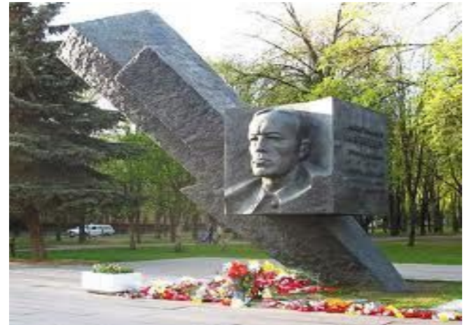
Памятник установлен в Москве на бульваре генерала Карбышева