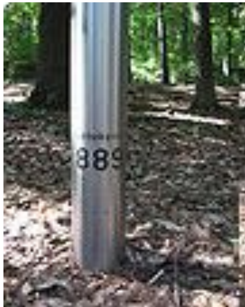
Один из металлических столбов на месте захоронения советского спецлагеря. Надпись: «Неизвестный 889»