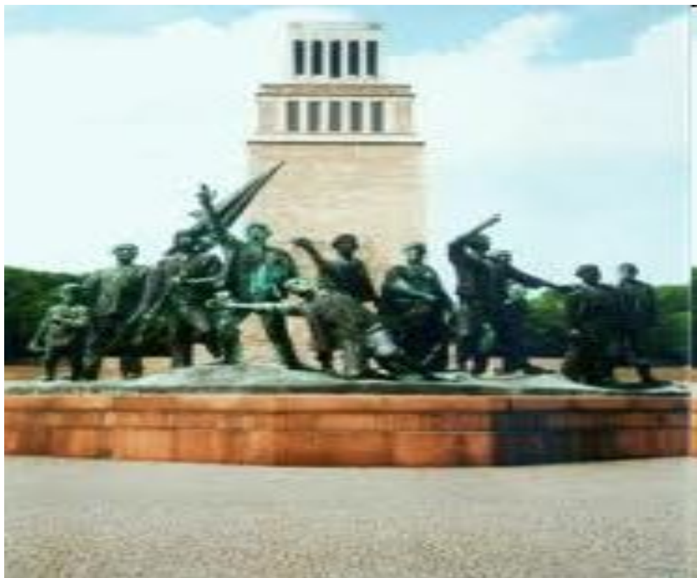
Памятник жертвам фашизма