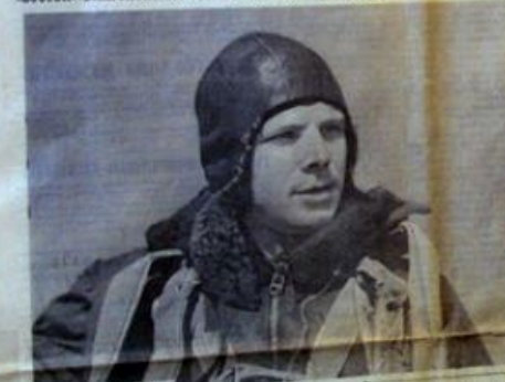
ЮРИЙ АЛЕКСАНДРОВИЧ ГАГАРИН

СОБЕТСКОМУ КОСМОНАВТУ, ВПЕРВЫЕ В МИРЕ СОВЕРШИВШЕМУ КОСМИЧЕСКИЙ ПОЛЕТ МАЙОРУ ГАГАРИНУ ЮРИЮ АЛЕКСАНДРОВИЧУ Великая победа разума и труда... Мир рукоплещет Юрию Гагарину... И коммунистической партии и народом Советского Союза!