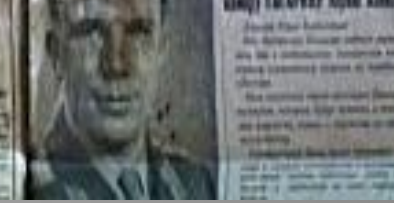
ЮРИЙ АЛЕКСАНДРОВИЧ ГАГАРИН

Советскому ученому, первому в мире совершившему космический полет, майору ГАГАРИНУ ЮРИЮ АЛЕКСАНДРОВИЧУ