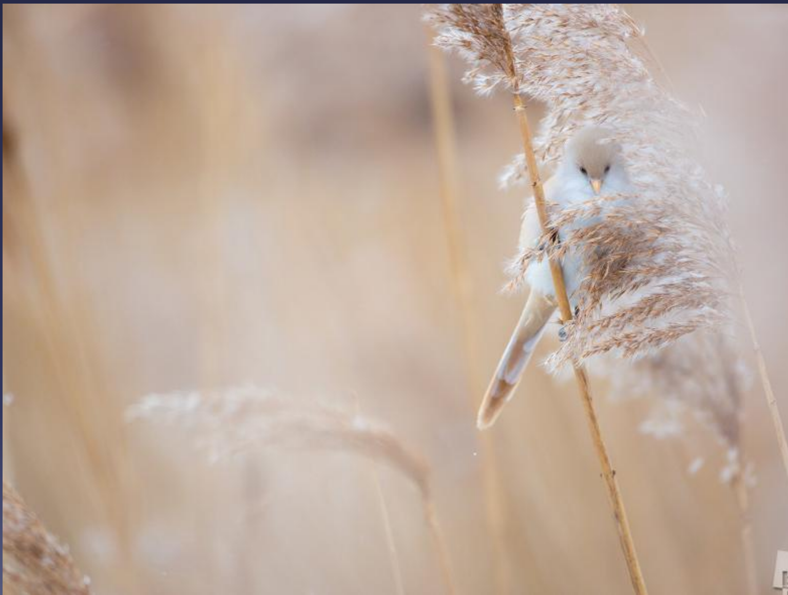
«Стесняется». Сергей Белых, город Грязи, Липецкая обл.