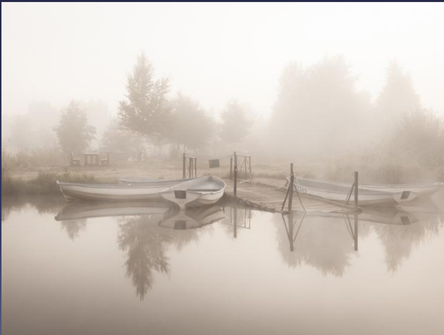
«У причала». Озеро Разлив, Анна Пакутина, город Сестрорецк