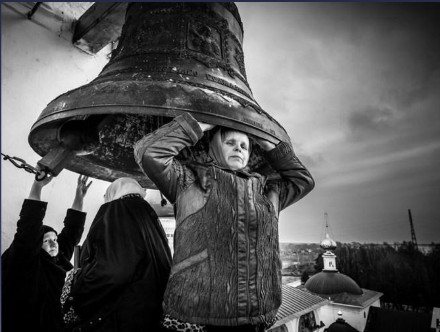
«Пасха». Свято-Введенский Толгский женский монастырь. 5 мая 2013г. Владимир Орлов, поселок Толга, Ярославская обл.