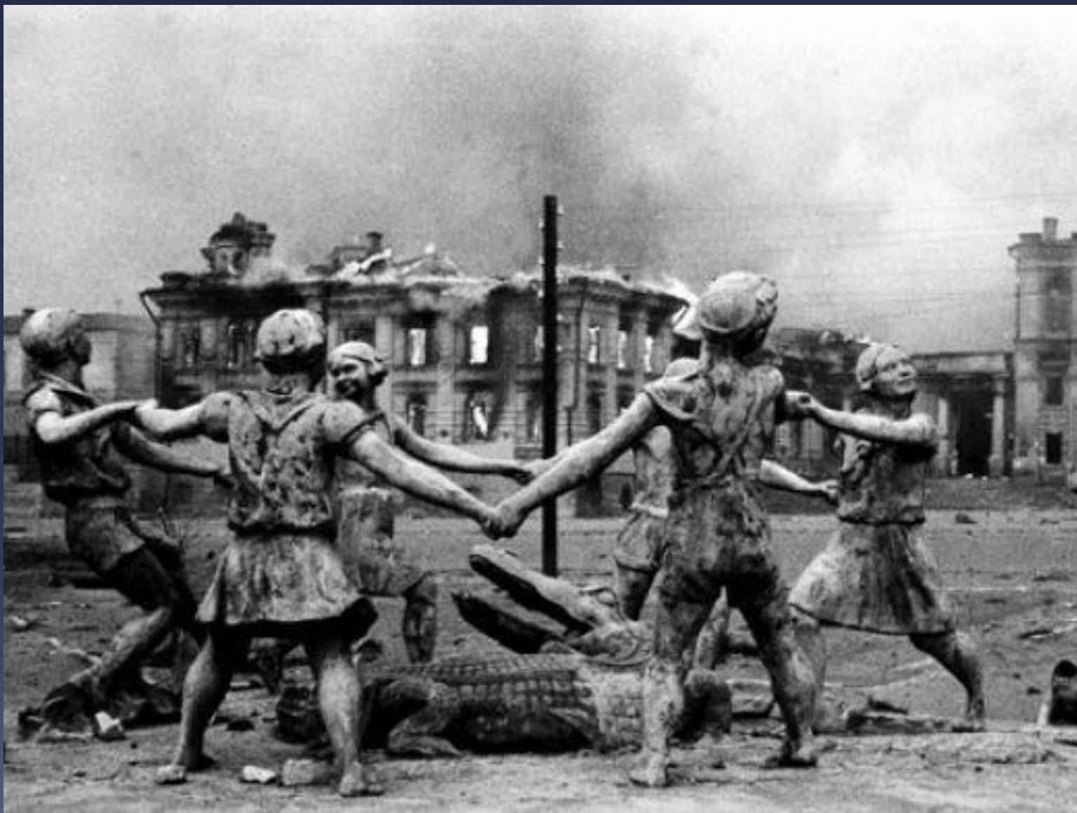
«Детский хоровод», Сталинград, 23 августа 1942 года