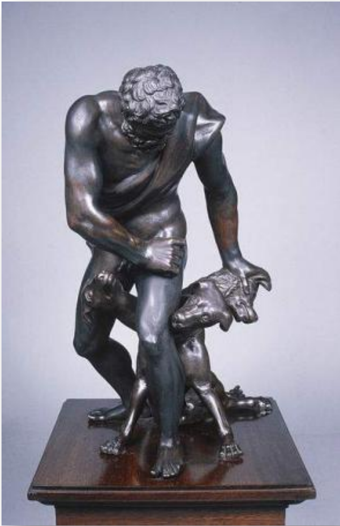
▣ Джамболонья, Геракл и Цербер