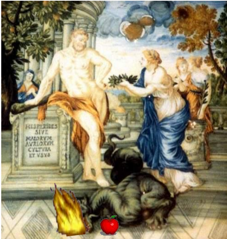
Кастелли д'Абруцо, Геракл и Геспериды