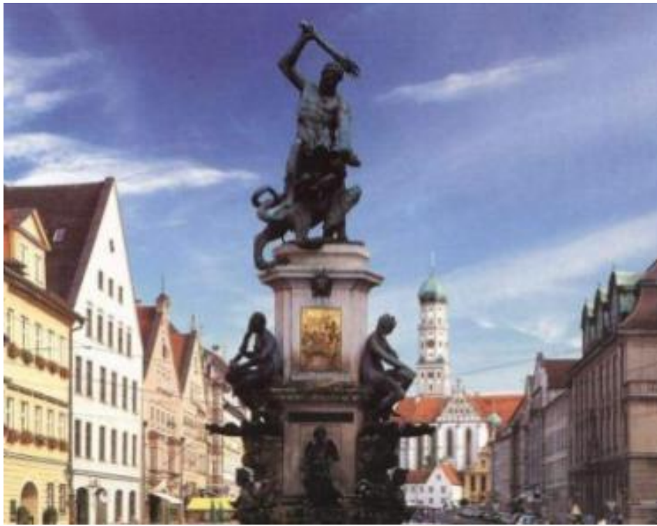
Андреас де Вриес, Фонтан Геркулес, 1602 , Аугсбург