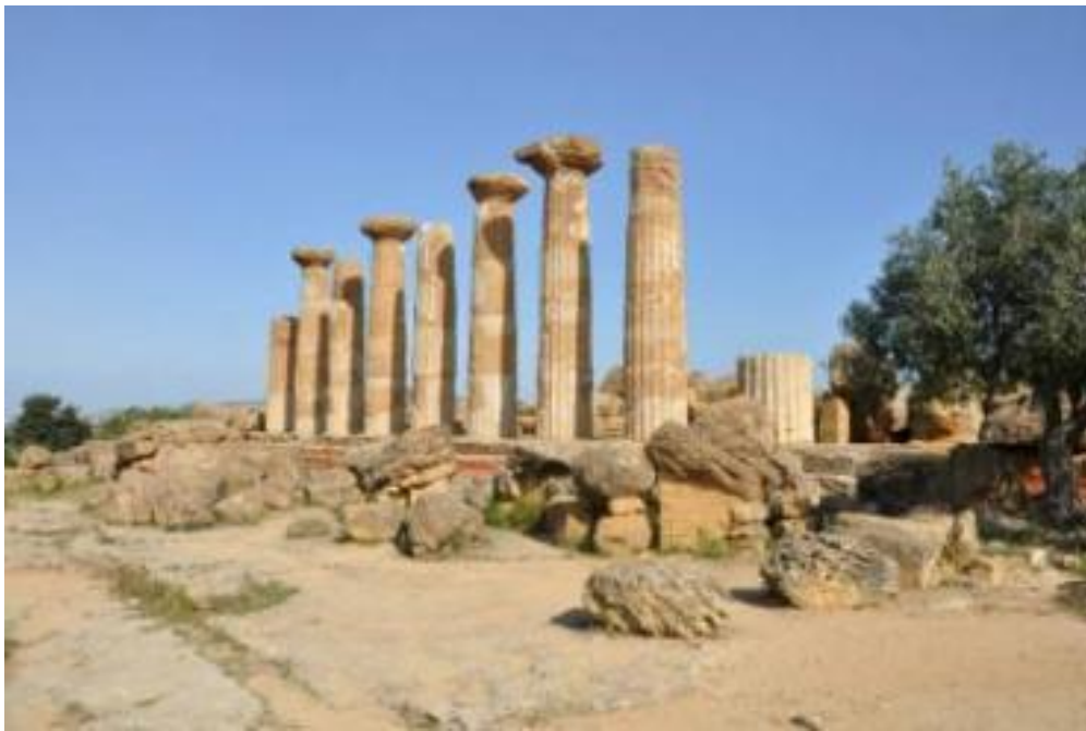
Храм Геракла, долина храмов, Агридженто, Сицилия