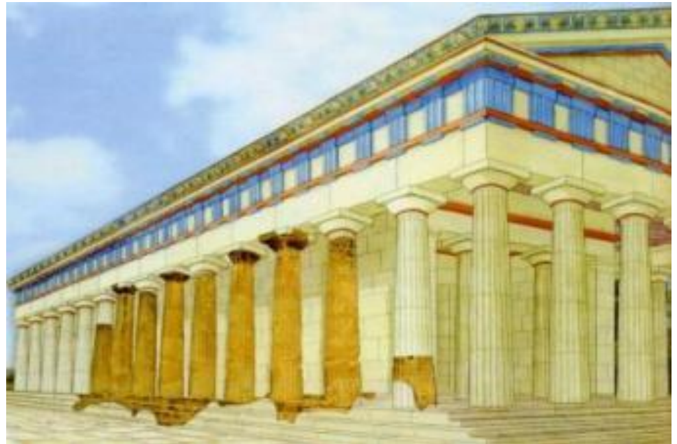
Храм Геракла, реконструкция, долина храмов, Агридженто, Сицилия