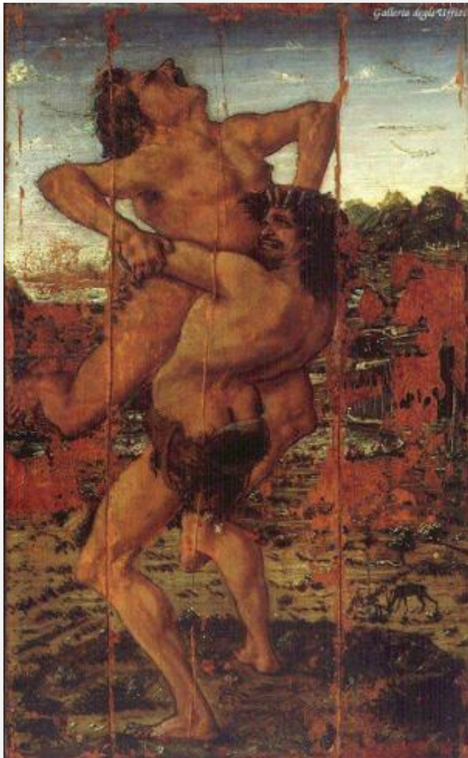
Поллайоло, Геракл и Антей