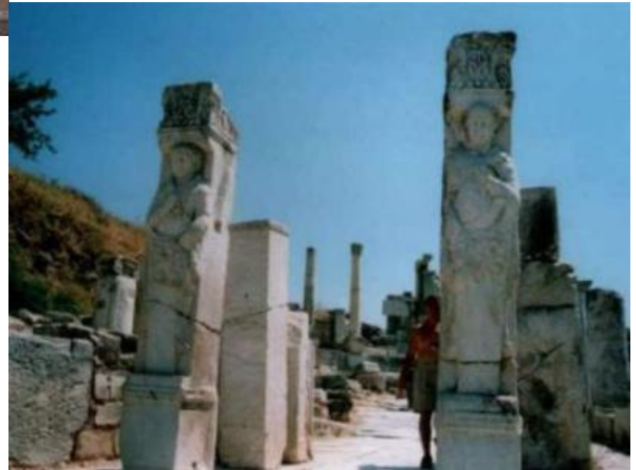
Ворота Геракла, Эфес, Турция