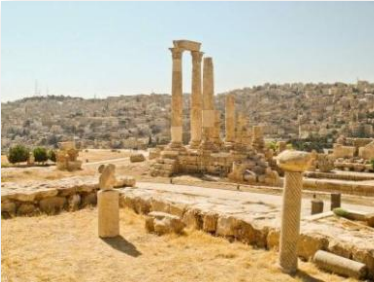
Храм Геркулеса, Амман, Иордания