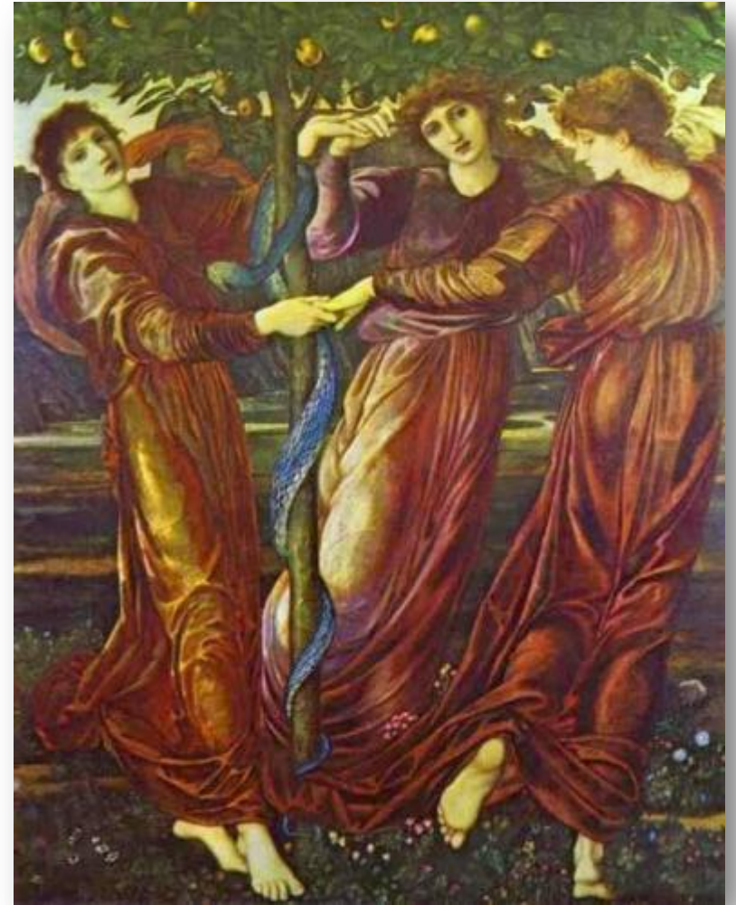
Бёрн-Джонс, Сад Гесперид, 1887