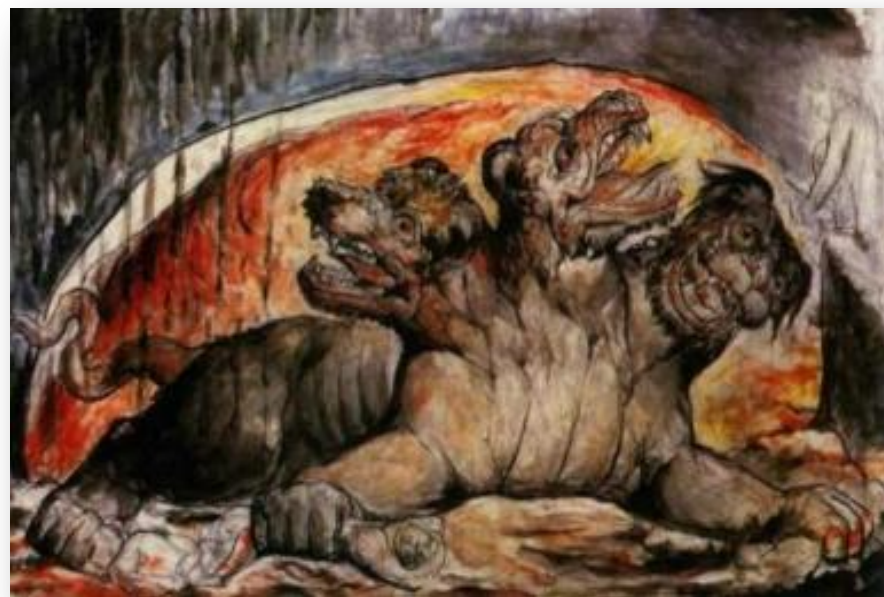
▣ Блейк, Цербер