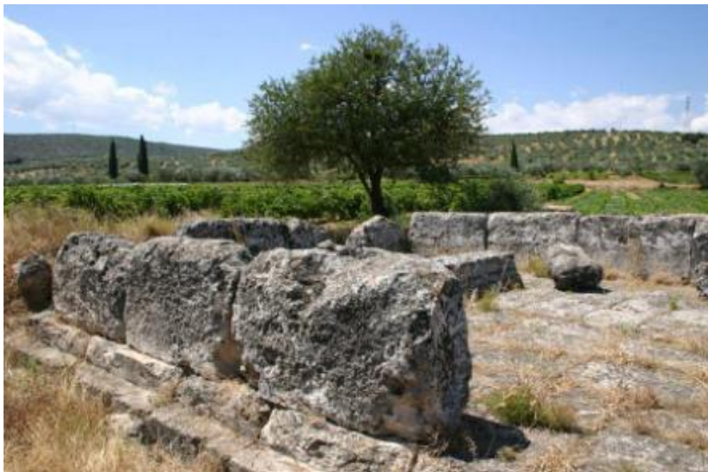
Руины храма Геракла в Арголиде, Греция