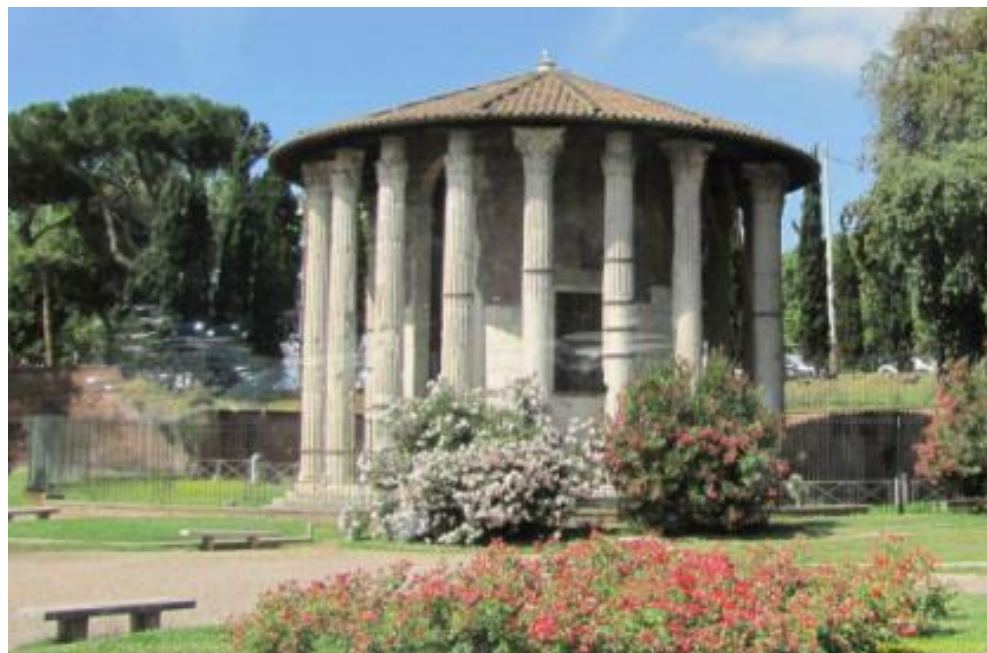
Храм Геркулеса Победителя на Бычьем форуме в Риме