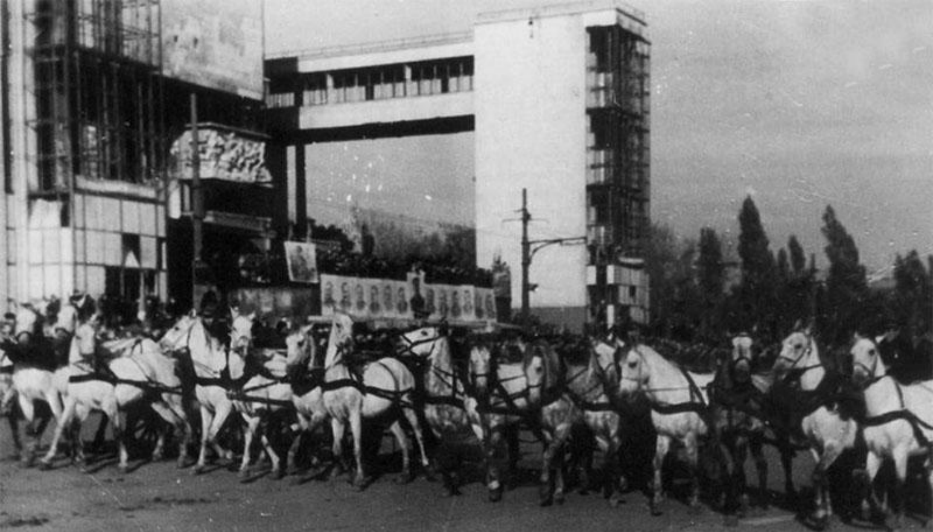
Парад победы в Ростове на Театральной площади 14 октября 1945 года.