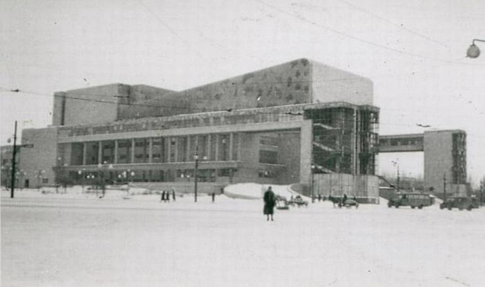
Театр им Максима Горького в годы войны