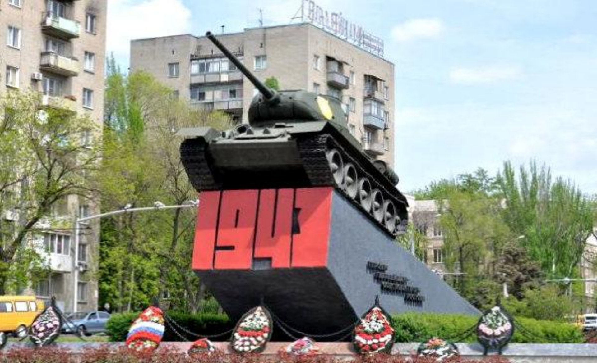
Памятник на Гвардейской площади посвященный освобождению Ростова-на-Дону