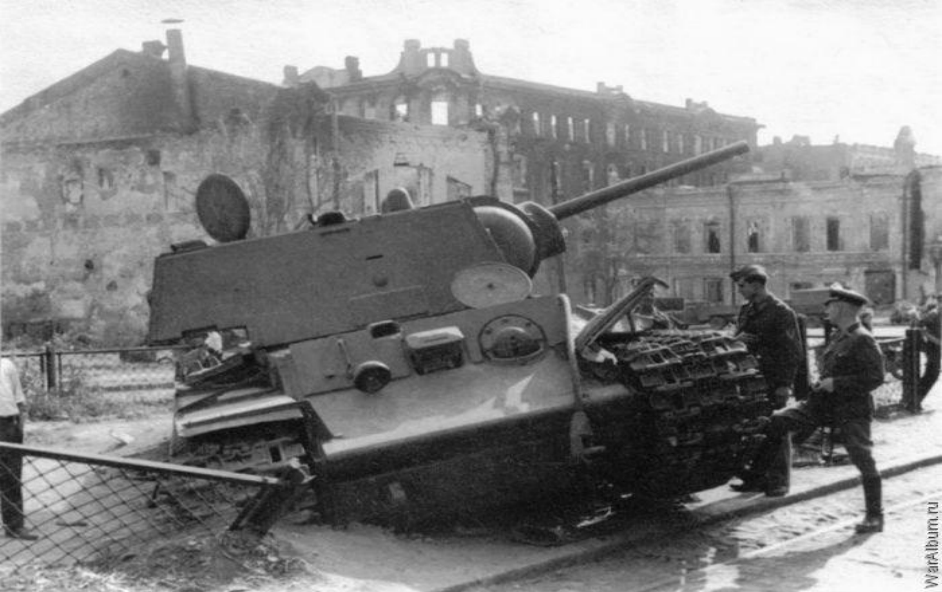
После боя. Танк КВ-1 на Базарной площади. Вид с улицы Московская.