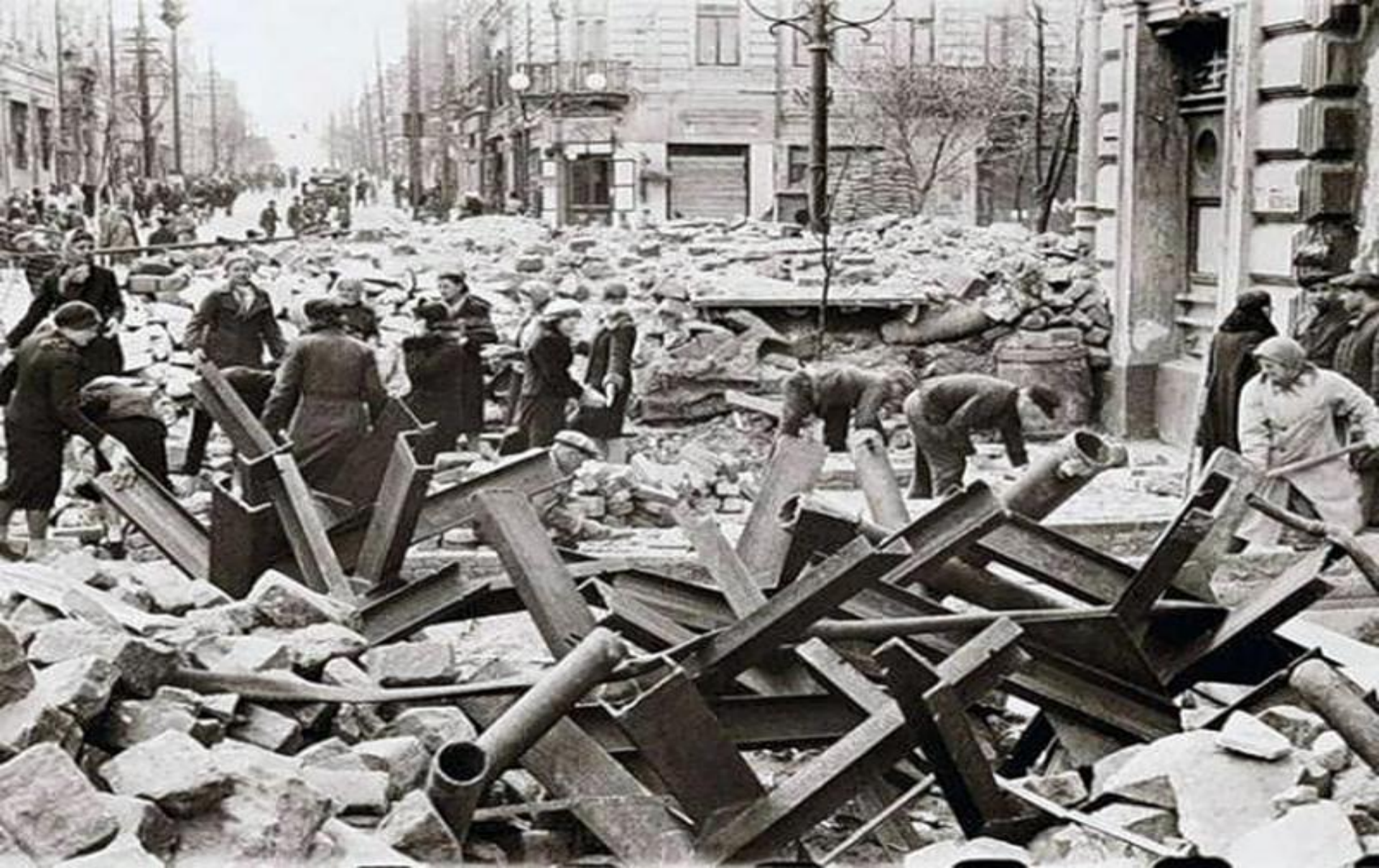
Улица Большая Садовая после освобождения, весна 1943 год