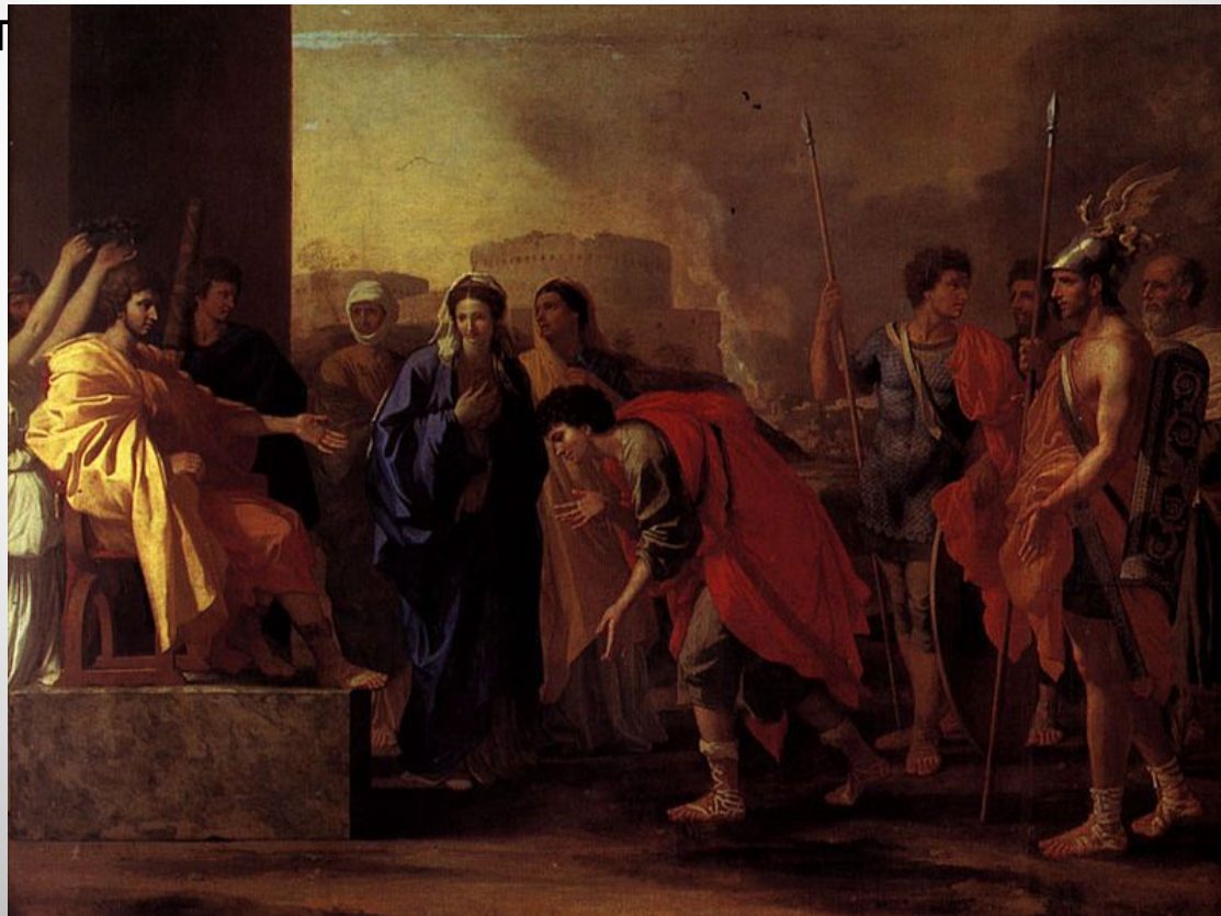
«Великодушие Сципиона Африканского»

В поздний период творчества Пуссен чаще обращается к таким сюжетам из Библии или античной истории, которые могли иметь воспитательное значение, главной целью своего искусства мастер считал пробуждение в своих современниках высоких понятий разума, добродетели, героизма.. Изображает только главное; второстепенное, случайное отбрасывается; все в его картинах строго обосновано, рассчитано, продумано, содержание воспринимает