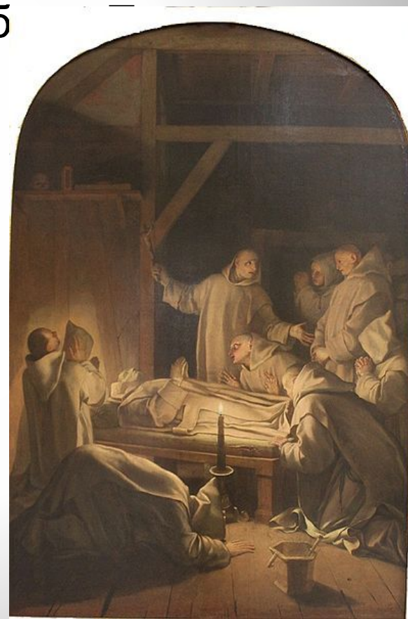
«Смерть св. Бруно» Лувр