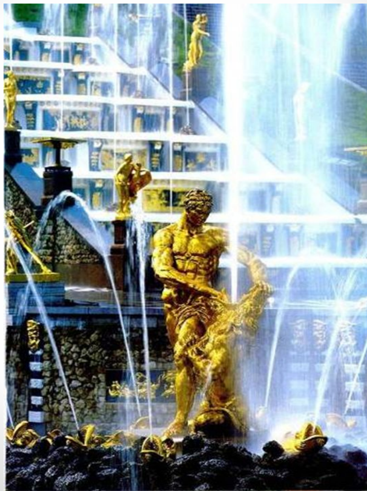
«Самсон разрывающий пасть льва» Скульптор М. Козловский

Богатырь Самсон олицетворял Петра I и русское воинство, а лев – поверженных шведов, на государственном гербе которых был изображен лев.