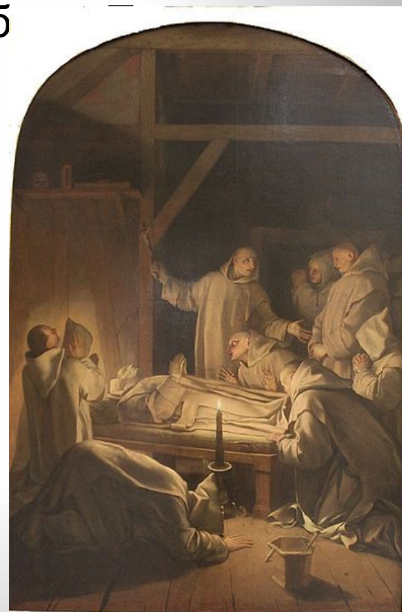
«Смерть св. Бруно» Лувр