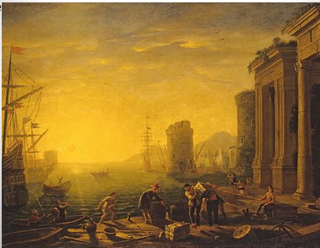
«Утро в гавани», 1640-е Эрмитаж

Клод Лоррен был исключительно пейзажистом. В своих живописных работах он явился типичным представителем классицистического пейзажа. Однако произведения Клода Лоррена отличаются очень большим своеобразием и в выборе мотивов и в их трактовке