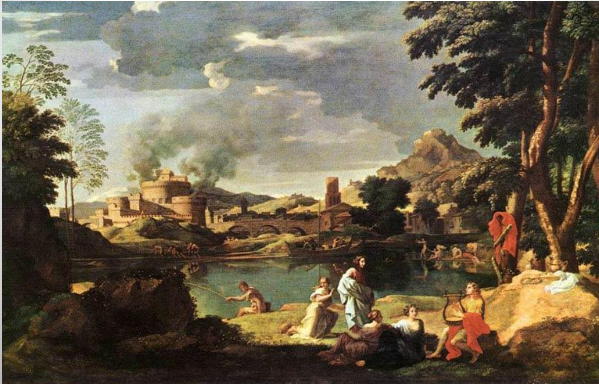
Пейзаж с Орфеем и Эвридикой

Рационалистический принцип полностью торжествует в его искусстве. Строгая организованность и рассудочность композиций, подчиненных простейшим геометрическим формам, граничат с ясностью математического расчета. Пространство четко делится на планы, причем в построении композиций Пуссен обычно использует приемы римских рельефов; главное действие разворачивается на сравнительно неглубокой площадке переднего плана, все строится на точно продуманном ритме рассчитанных, уравновешенных движений.