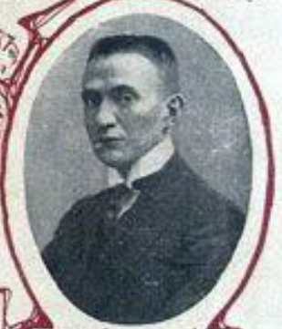
А. Ф. КЕРЕНСКИЙ, МИНИСТРЪ ЮСТИЦИИ