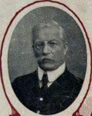
П. Н. МИЛУКОВЪ, СУББОРСЪ И КАБРИНЪ-БАШЪ