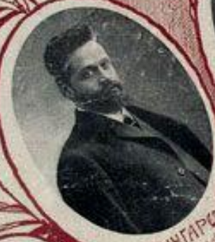
А. М. ШИНГАРЕВЪ, МИН. ВЪДЪЛЪ РАБОТЫ