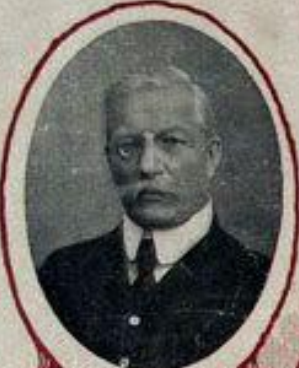
П. Н. МИЛУКОВЪ, СЪЮЗНИКЪ И КАБРИНЕТЪ