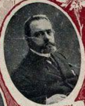
А. И. ГУЧКОВЪ, ВОСКРИШИ И ПЕРСОНА СУИ