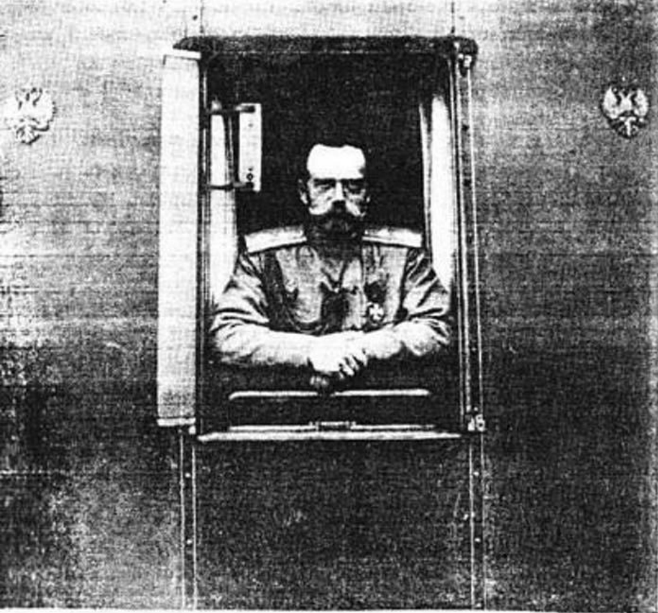
Государь Императоръ Николай II послѣ отреченія.