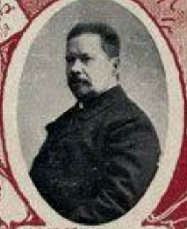
В. В. ГОДЕВЪ, ГОСУДАРСТВЕННЫЙ КОНТРОЛЕРЪ