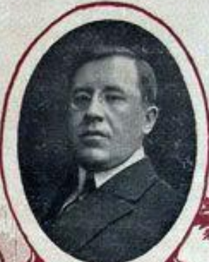
А. И. КОНОВАЛОВЪ, МИН. ТОВАРИСТВА И ПРОМЫСЛА