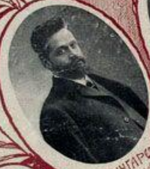
А. М. ШИНГАРЕВЪ, МИНИСТРЪ ДЕРЖАВЪ