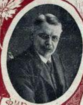
Ф. И. РОДИЧЕВЪ, МИН. ВЪДЪЛЪ РАБОТЫ