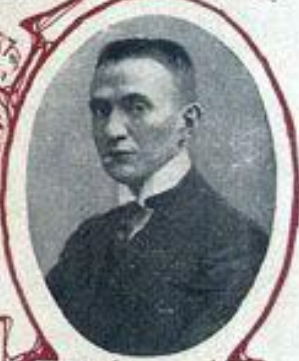
А. Ф. КЕРЕНСКИЙ, МИН. ВЪДЪЛЪ РАБОТЫ