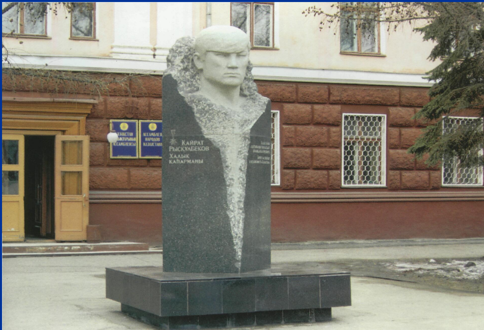
Халық қаһарманы Қайрат Рысқұлбековке орнатылған ескерткіш. Семей қаласы