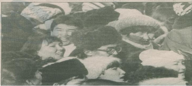
Алматы. 1986. Желтоқсан.