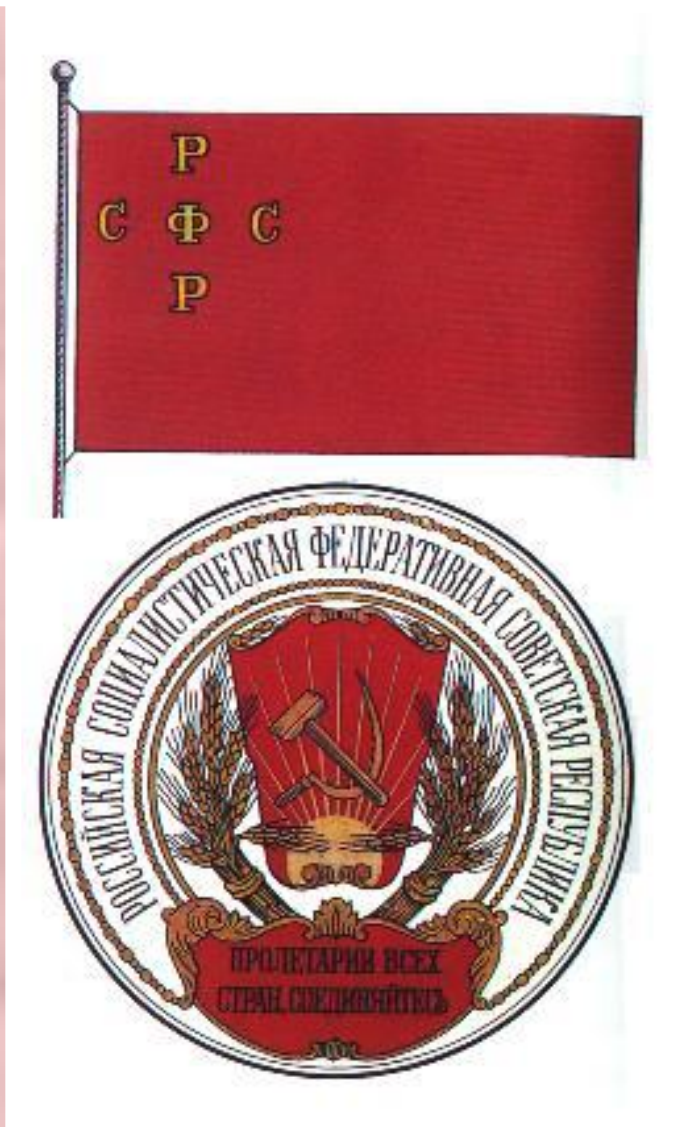
Флаг и герб РСФСР.

Гряд национальных окраин вошел в состав РСФСР на правах автономий. 1 ноября советская власть победила в Туркестане. В к.ноября в Коканде было провозглашено мест-ное национальное прави-тельство, но вскоре оно было ликвидировано красногвардейцами и Ту ркестан вошел в состав РСФСР. Недовольные этим начали басмачес-кое движение. Весной 18 г.в составе РСФСР были созданы Татаро-Башкир ская и Кубано-Черномор ская автономные респу-блики.