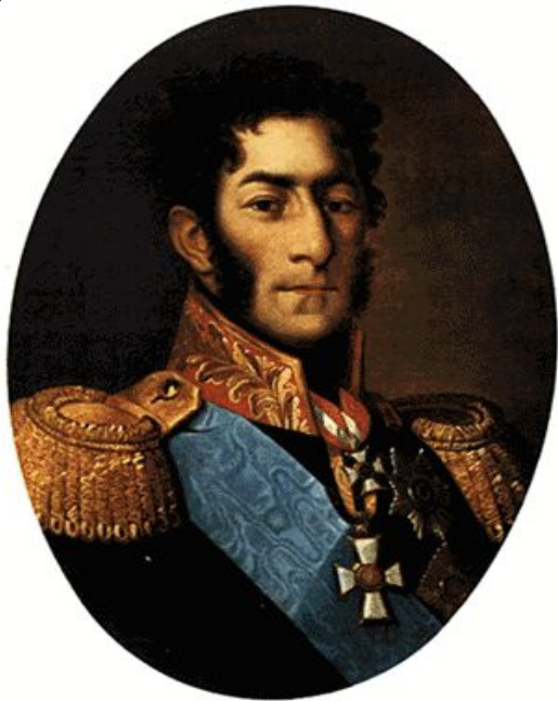
П. И. Багратион