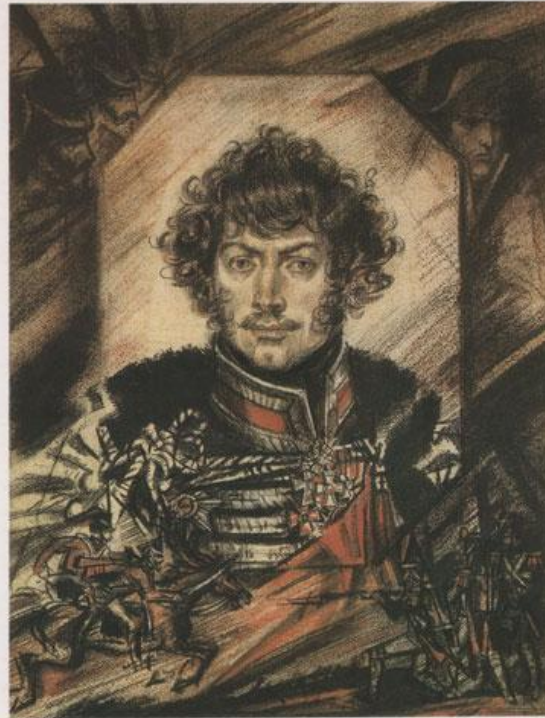
Александр Никитич Сеславин 1780—1858