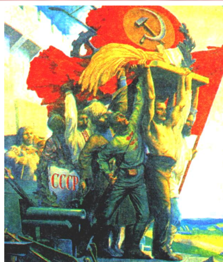
С.Карпов. Дружба народов.

Представители коренных народов привлекались к управлению государством, для них создавались льготы при приеме в ВУЗы. Но «коренизация» имела и отрицательные моменты. В Киргизии началось насильственное переселение русских с их земель. На Украине украинский язык стал государственным и без его знания нельзя было занимать никакие должности.