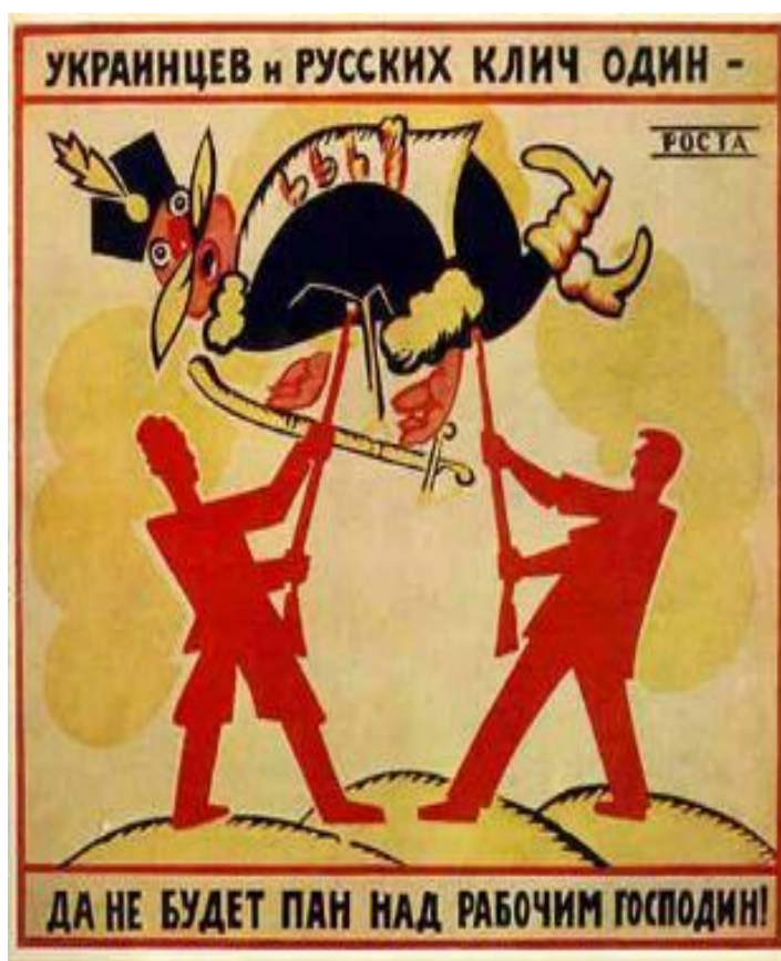
Плакат В.Маяковского. 1920 год.

По окончании войны на территории бывшей Российской империи образовалось полтора десятка государств. Самое крупное - РСФСР строилось по федеративному принципу и включало автономии и национальные округа.