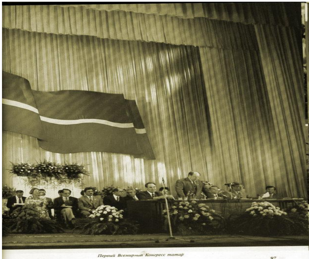
Первый Всемирный Конгресс татар